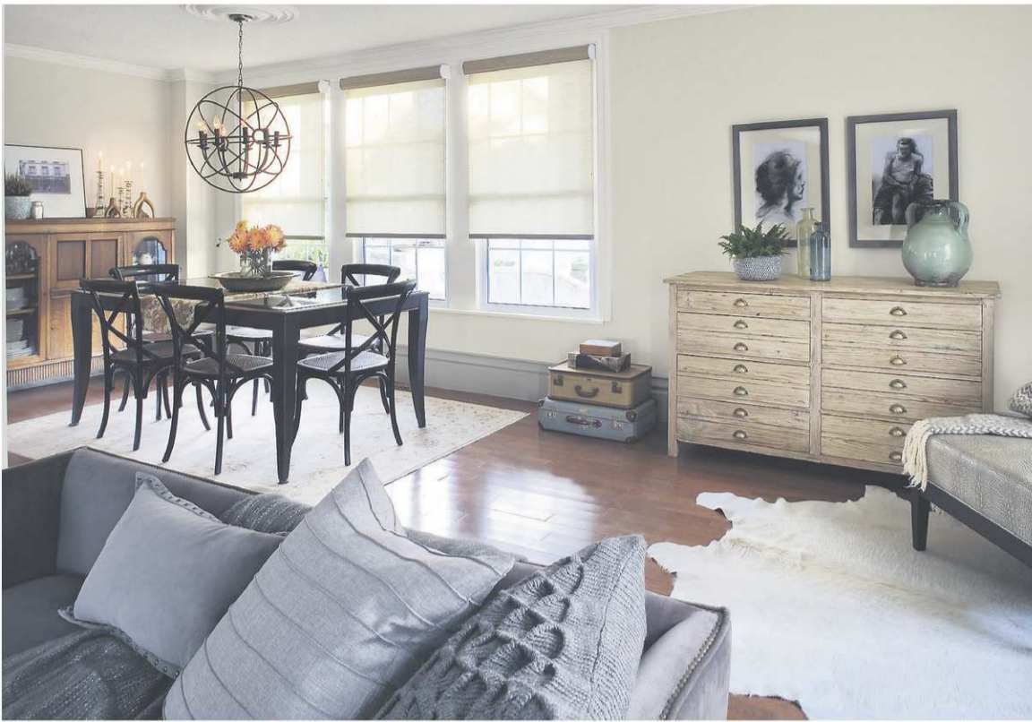
Une teinte naturelle chaude comme Baie secrète de Benjamin Moore s'harmonise à merveille avec les accessoires gris froids du salon.