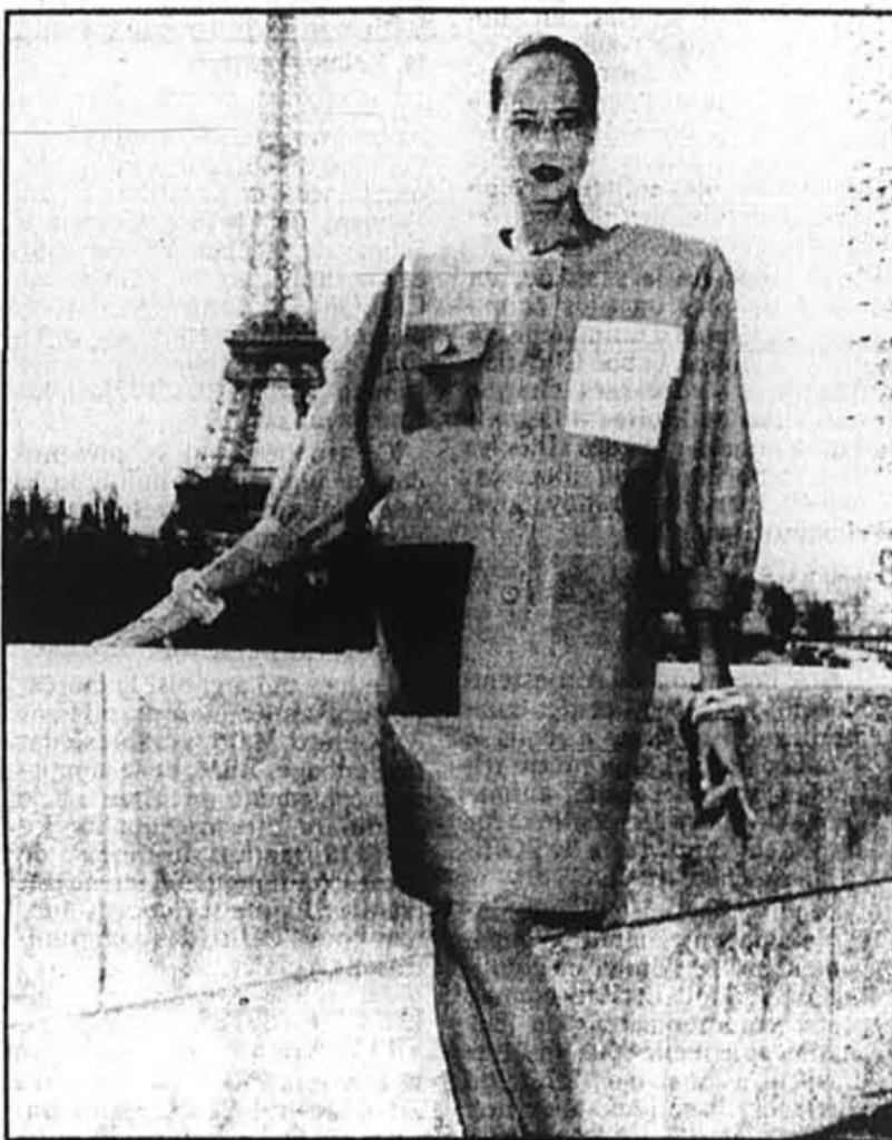
De larges poches de couleur rouge, turquoise, verte et jaune sur fond mauve, par Hubert de Givenchy.

Junko Koshino c'est l'espace, le futur, le plastique et le caoutchouc. Tout est court et près du corps. Comment en serait-il autrement pour toutes ces héroïnes de 20 ans qui vivent de bandes dessinées.