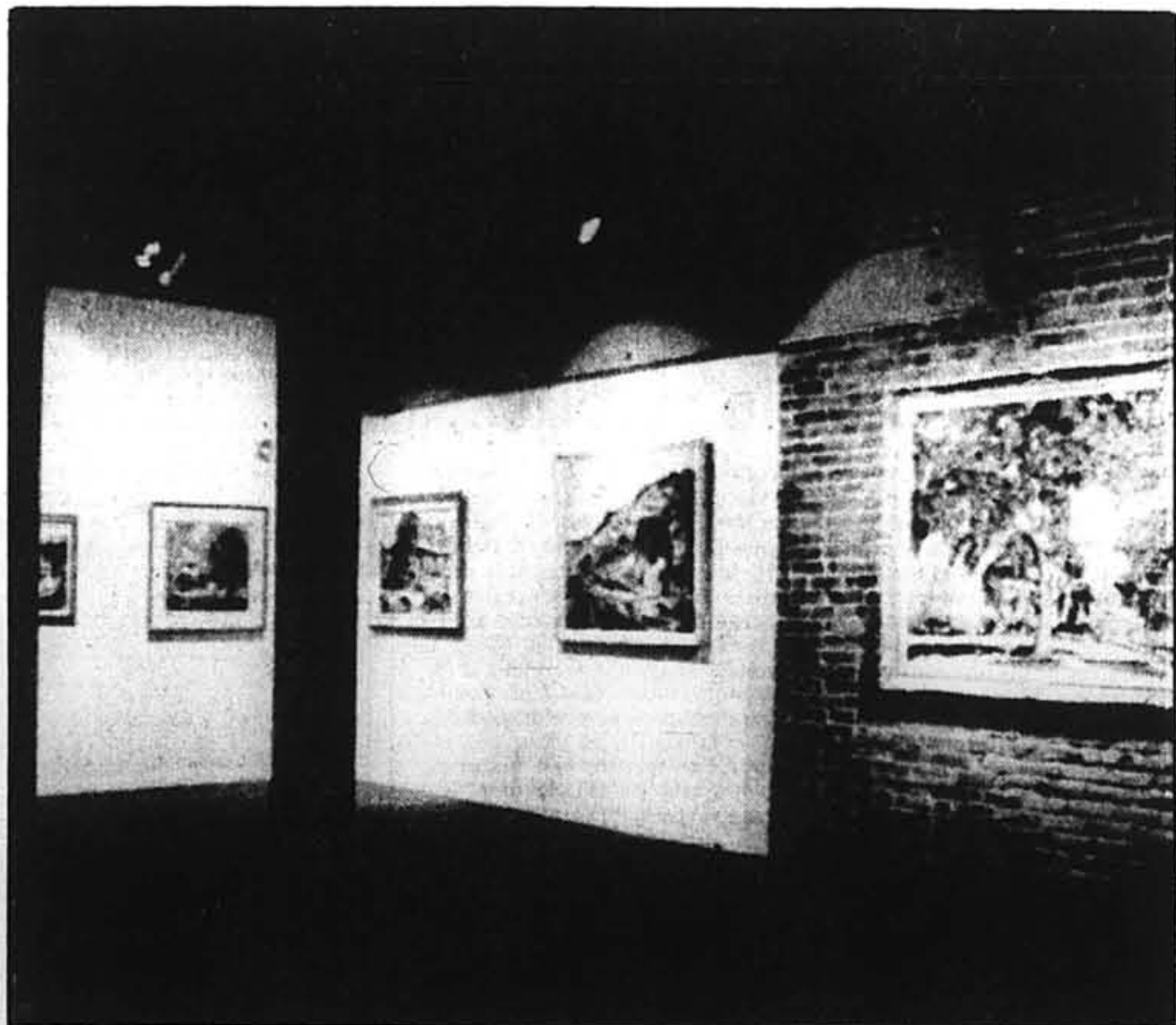
Depuis son ouverture il y a maintenant trois ans, le musée Marc-Aurèle Fortin, situé sur la rue Saint-Pierre à Montréal, ne cesse d'attirer les amateurs de peinture.

Rappelons que le record jamais atteint par une oeuvre d'art québécoise est $275 000 pour un Clarence Gagnon.