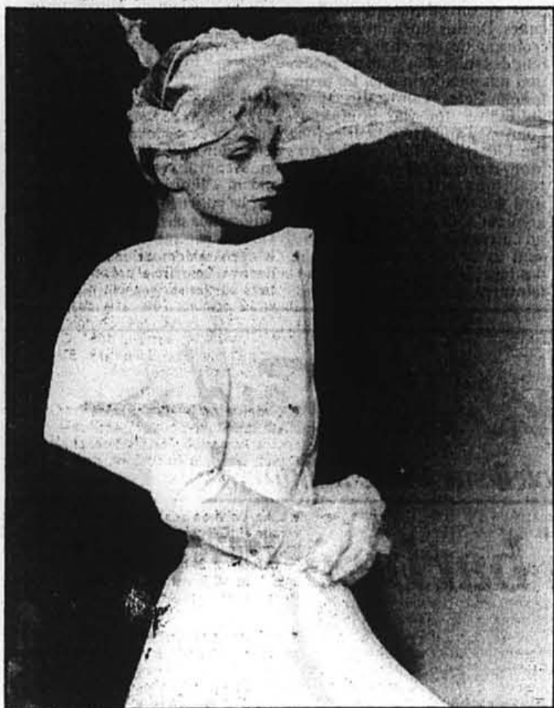
Le designer français Claude Montana donne dans la botanique, avec cette robe-tulipe surmontée d'un chapeau futuriste.