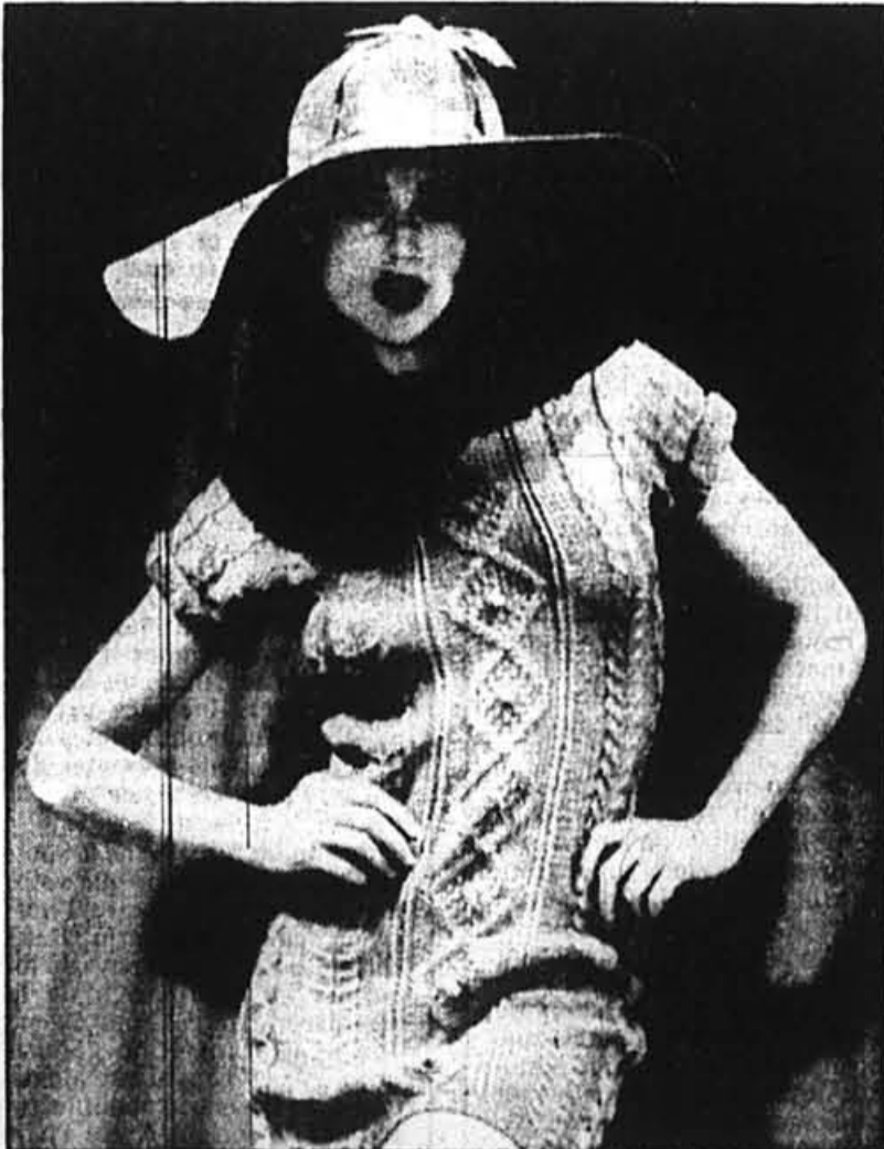
La designer Chantal Thomas déshabille allègrement tout ce qui bouge...