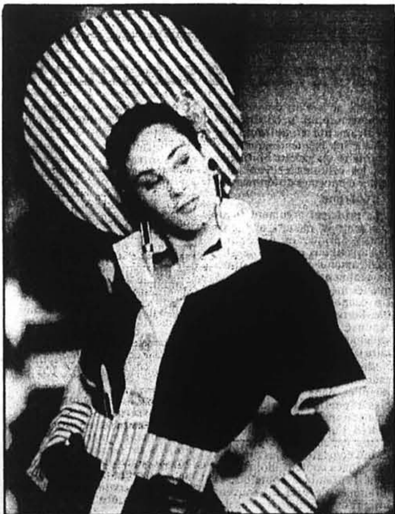
Une petite robe de coton, agrémentée de rayures qui courent dans tous les sens, signée par le designer ouest-allemand Karl Lagerfeld.