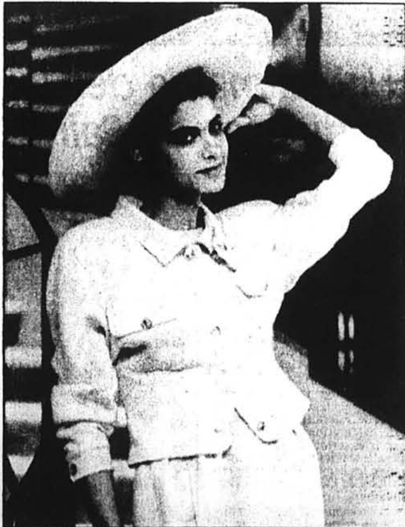
Un tailleur sage de Chanel