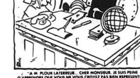
A M. PLOUK LATERREUR... VOUS CROITREZ PAS BIEN REPRESENTER D'APPRENDRE QUE VOUS NE VOUS CROITREZ PAS BIEN REPRESENTER