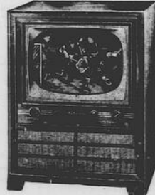
MODELLI DA UN MINIMO DI