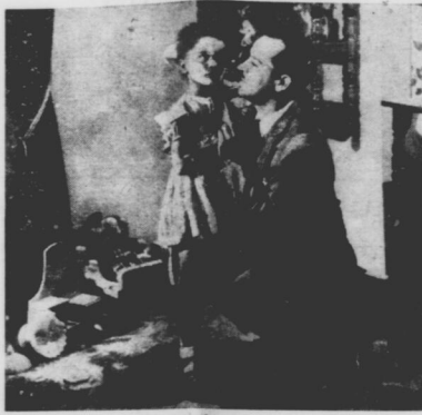
Prima visione a Montreal del film italiano „LITTLE DARK ANGELS“ (Piccoli angeli neri - Più bello che „Angelo“) parlato in italiano con didascalie inglesi, attualmente sullo schermo. Secondo film: „Raw Deal“ con Dennis O'Keefe.