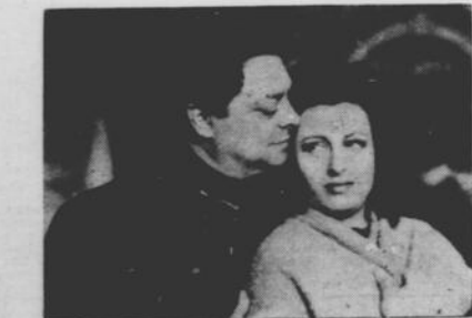
ALDO FABRIZI ed ANNA MAGNANI in una scena del film "CAMPO DEI FIORI" ("The Poddler and the Lady"), parlato in italiano con didascalie inglesi, attualmente sullo schermo del cinema AVON per una settimana.