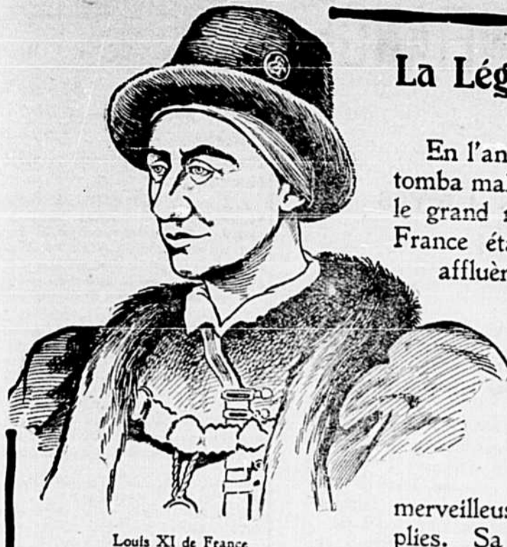
Louis XI de France