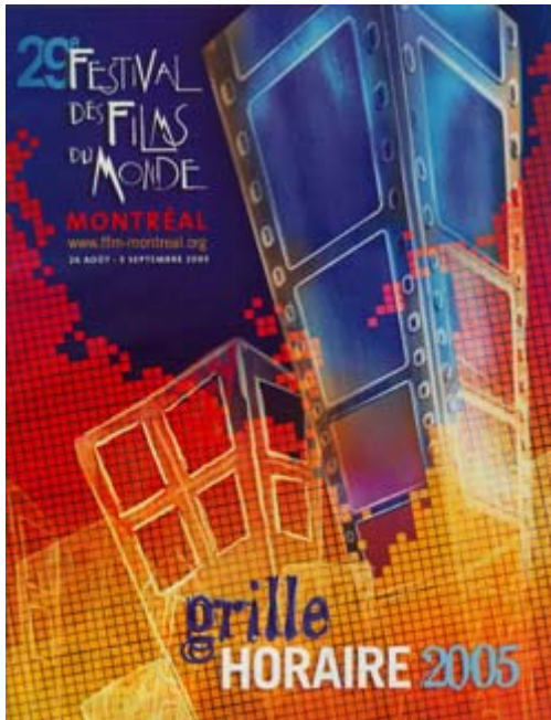
Le Festival des Films du Monde 2005

Le Canada sera la scène de grands rassemblements cinématographiques durant les prochaines semaines alors que se tiendront le Festival des Films du Monde de Montréal du 26 août au 5 septembre, le Festival des Films de Toronto du 8 au 17 septembre, et le Festival international de films de Montréal, lancé pour la première fois cette année par Alain Simard du groupe Spectra, du 18 au 25 septembre.