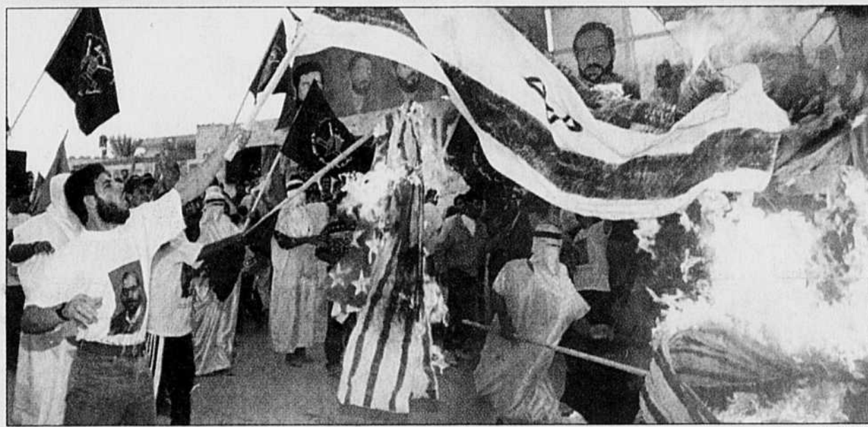
Le président de l'Autorité palestinienne Yasser Arafat, le président américain Bill Clinton et le premier ministre israélien Benjamin Nétanyahou ont rendu un hommage appuyé hier au roi Hussein de Jordanie lors de la cérémonie de signature de l'accord israélo-palestinien à la Maison-Blanche, un accord obtenu à l'arraché après neuf jours de pourparlers. Pendant ce temps, dans la bande de Gaza, des manifestants palestiniens ont brûlé hier des drapeaux israéliens et américains lors d'une manifestation contre la signature de l'accord israélo-palestinien.