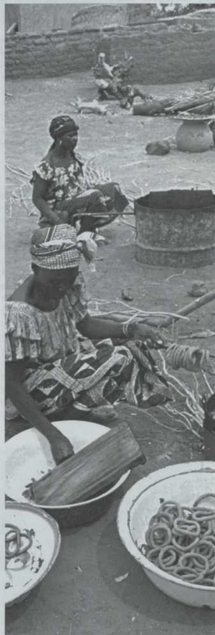
La cuisson des beignets d'arachide. Village de Yaco, Burkina Faso.

On peut faire bien des choses avec de petites sommes dans un pays en développement. Acheter un peu de bétail, par exemple - dans certaines parties du monde, le propriétaire d'une vache est une personne riche -, ou encore des semences et quelques outils aratoires. Faire l'acquisition d'un métier à tisser pour faire vivre la famille. Mieux encore, se regrouper en coopérative et acheter quelques métiers à tisser, du matériel de teinture et faire vivre tout le village avec la fabrique de tissus! Si la prospérité augmente, les enfants auront davantage de chances d'aller à l'école plutôt que de travailler, car, une fois les besoins primaires comblés, on accorde plus d'importance à l'éducation. La communauté, confiante dans ses ressources, se dotera de meilleurs équipements sanitaires, et les maladies endémiques feront moins de ravages. De nouvelles entreprises seront créées et les femmes, souvent responsables des moyens de production qui font vivre toute la famille, seront moins durement touchées par la pauvreté, de même que leurs enfants. Le mécanisme économique sera enfin enclenché dans la bonne