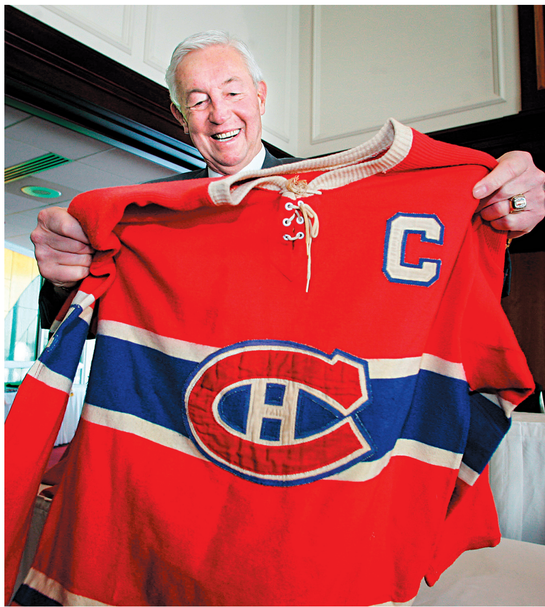
Capitaine des Canadiens de Montréal pendant dix saisons, Jean Béliveau a été choisi six fois dans la première équipe d'étoiles de la LNH et il a aidé les Canadiens à gagner dix coupes Stanley.

Ce portrait est vrai, mais incomplet. Repartons-nous 60 ans en arrière. Quand Jean Béliveau se joint pour de bon aux Canadiens, le 5 oc-