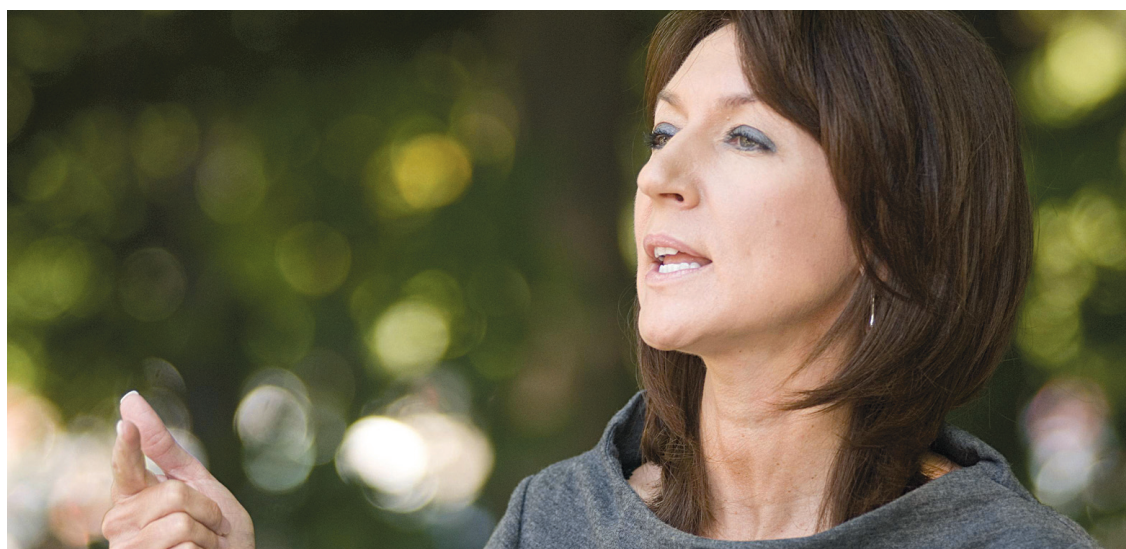
PEDRO RUIZ LE DEVOIR

Les 18 signataires, dont 11 sont des auteurs ou coauteurs de livres récents sur les sources