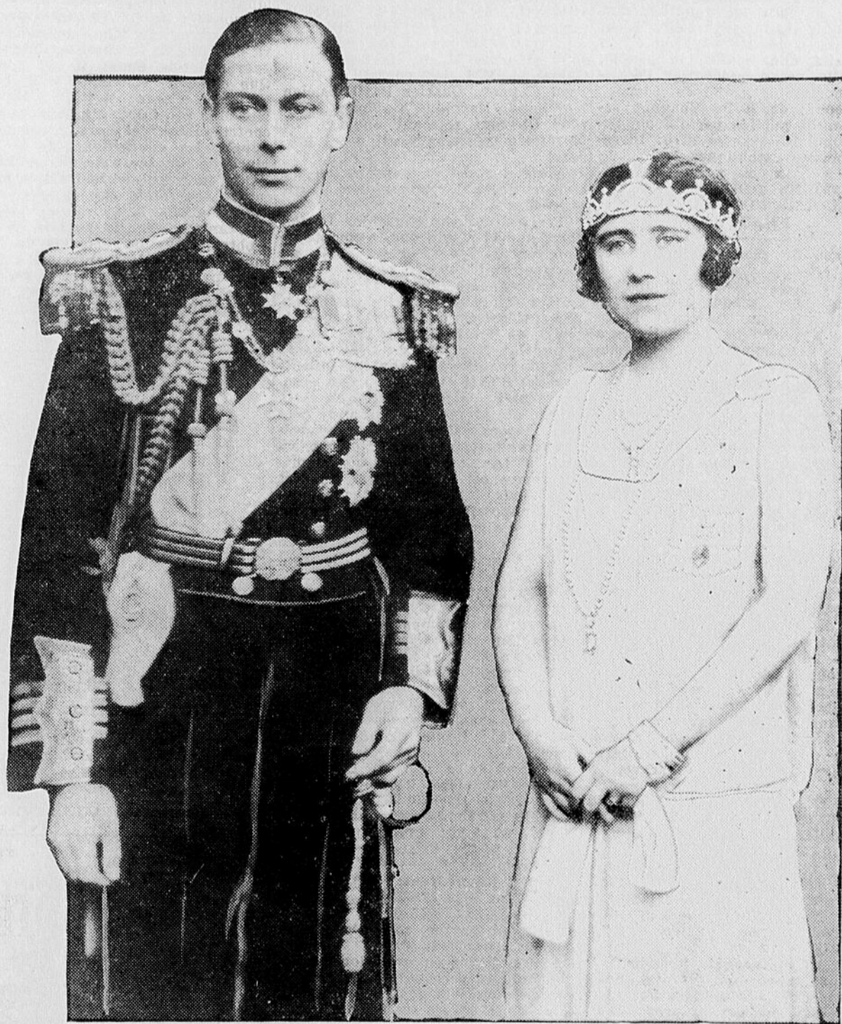
Leurs Majestés Georges VI, roi d'Angleterre, et de l'Irlande et des Dominions, empereur des Indes et sa gracieuse épouse qui seront tout probablement couronnés le 12 mai prochain.