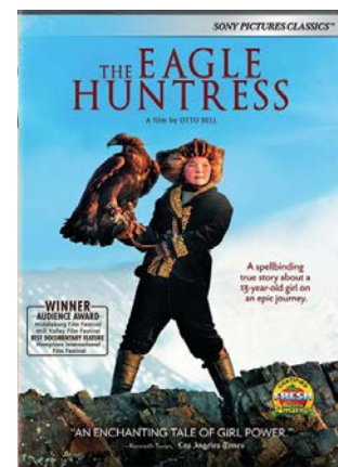
THE EAGLE HUNTRESS DOCUMENTAIRE