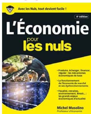
L'ÉCONOMIE POUR LES NULS PAR MICHEL MUSOLINO