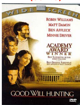
LE DESTIN DE WILL HUNTING DRAME