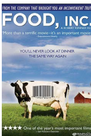
LES ALIMENTEURS DOCUMENTAIRE