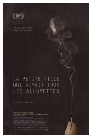
LA PETITE FILLE QUI AIMAIT TROP LES ALLUMETTES DRAME