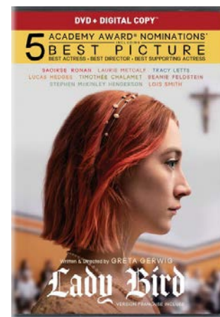
LADY BIRD DRAME