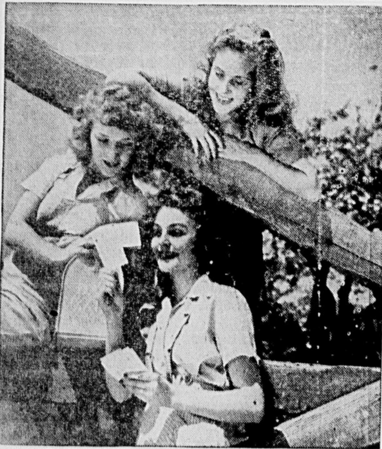
Un groupe bien formé produit un instantané plein de vie, qui décrit avec éloquence le plaisir qu'on prend à dépouiller le courrier du matin.