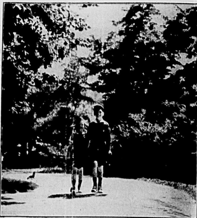
Les portraits simples sont généralement les meilleurs si vous vous approchez du sujet le plus possible. Il est parfois nécessaire aussi de prendre le décor.