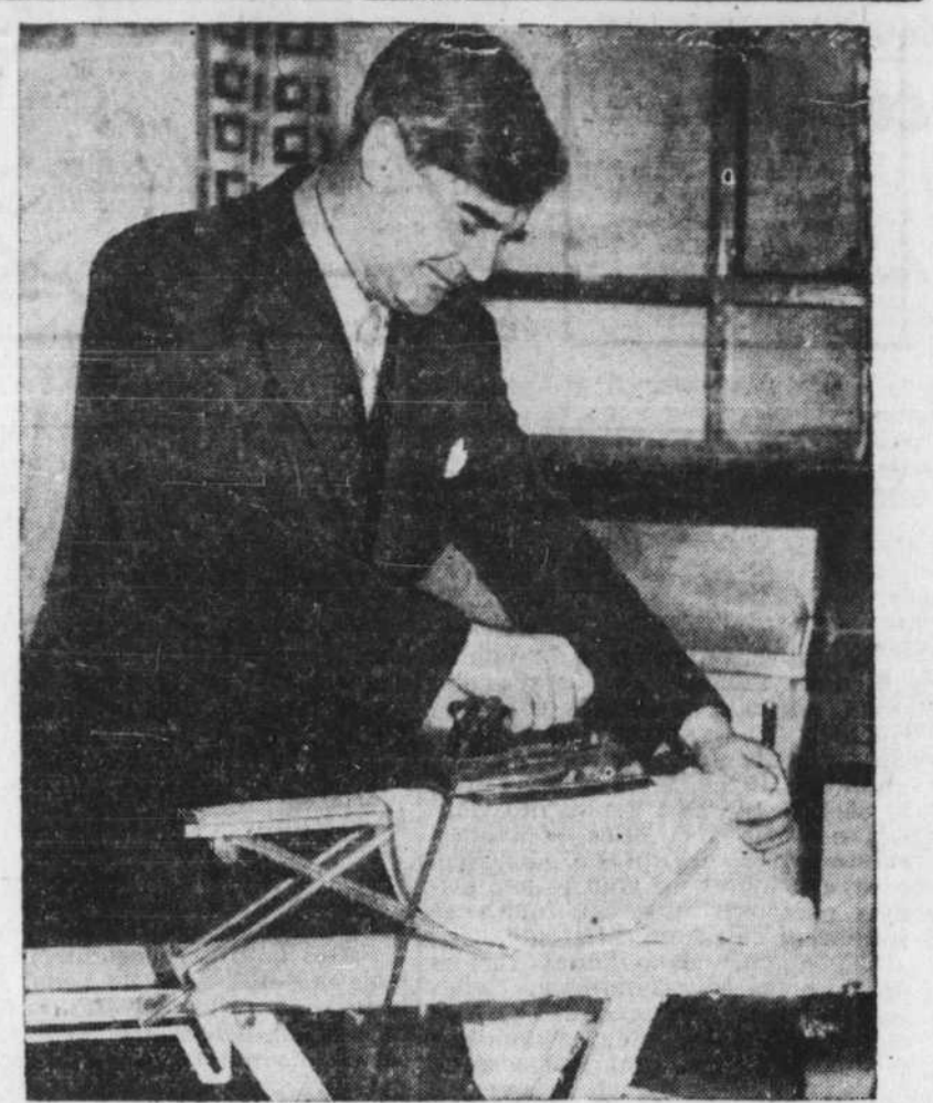
Le ministre anglais de la santé, Aneurin Bevan, met à l'épreuve un fer à repasser électrique. Le ministre se trouve actuellement dans la cuisine d'une maison du type préfabriqué actuellement exposée au public à Londres.

Chutes dangereuses — La statistique révèle que 50 pour 100 des accidents mortels à l'intérieur des maisons sont des chutes.