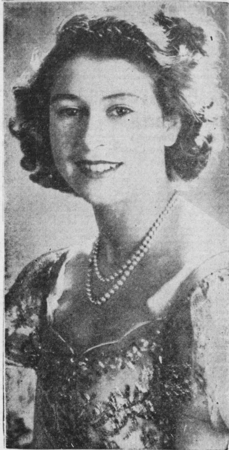
Voici la dernière et une des meilleures photographies de Son Altesse Royale la Princesse Elisabeth d'Angleterre. Elle porte ici une fraîche et somptueuse toilette de dentelle et de tulle rosés garnie de paillettes.