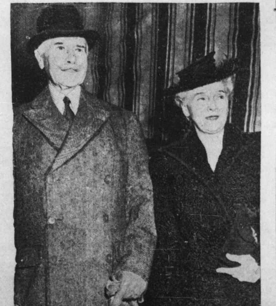
Le comte d'Athlone et la princesse Alice se sont embarqués dimanche pour l'Angleterre.

au coin des rues Colborne et Notre-Dame un homme qui lui a demandé de le conduire au coin des rues Wellington et Charron. Une fois dans l'auto le voleur ne perdit pas de temps et il pointa son revolver dans le dos du chauffeur et lui en anglais qu'il s'agissait d'un vol à main armée. Le chauffeur dut donner $26 de sa poche. L'incor serait âgé d'environ 25 ans et mesurerait 5 pieds 6 pouces.