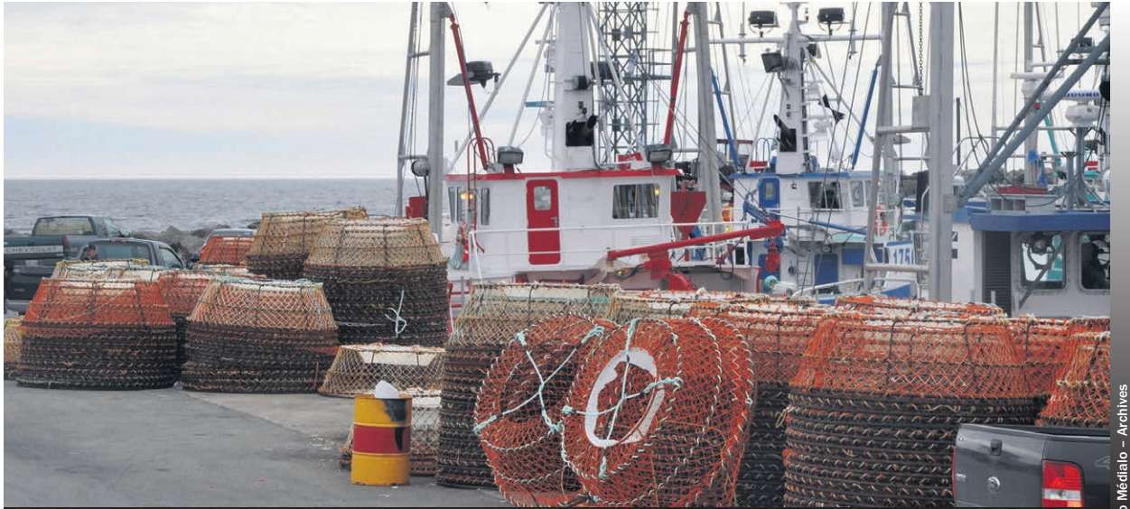
Une vingtaine d'entreprises de l'Est-du-Québec pourront bénéficier de ce projet de formation.

« L'annonce de cet investissement est une excellente nouvelle pour les entreprises du secteur des pêches et de la transformation des produits marins de l'Est-du-Québec. Ce projet de formation répond aux besoins de plusieurs employeurs désirant rehausser les compétences de leurs personnels et ainsi favoriser leur développement