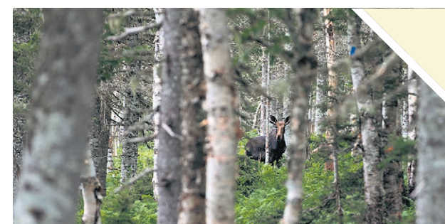
Ce permis ne peut être utilisé qu'une seule fois dans une vie.

Ce permis facilite l'accès à la chasse en éliminant la barrière initiale de la formation obligatoire, permettant ainsi aux participants de découvrir l'activité avant de décider de poursuivre leur apprentissage. Il s'agit d'une première étape idéale pour quiconque envisage de devenir chasseur, offrant une immersion directe dans l'expérience tout en assurant le respect des normes de sécurité et de réglementation. Pour plus d'informations sur l'obtention du permis d'initiation et les démarches associées, les intéressés peuvent visiter la page de la Fédération québécoise des chasseurs et pêcheurs ici.