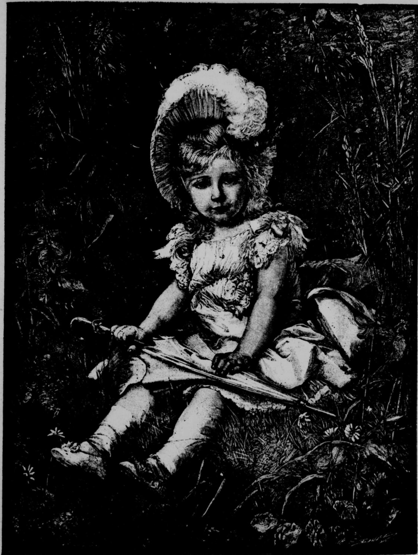
AU JARDIN. — TABLEAU DE M. LOBICHON

La ligne, par insertion . . . . . 10 cents Insertions subséquentes . . . . . 5 cents Tarif spécial pour annonces à long terme