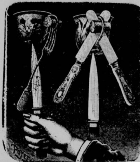
ÉQUILIBRE DE LA TASSE À CAFÉ

Choisissez, de préférence, une tasse à café dont le fond soit légèrement bombé à l'intérieur et concave en dessous ; notre dessin indique suffisamment la manière dont le centre de gravité a été abaissé au moyen d'une fourchette piquée dans le bouchon que vous aurez fixé dans l'anse. Il vous sera dès lors facile de faire tenir l'ensemble du système en équilibre sur la pointe d'un couteau, même si la tasse est à moitié pleine de café noir.