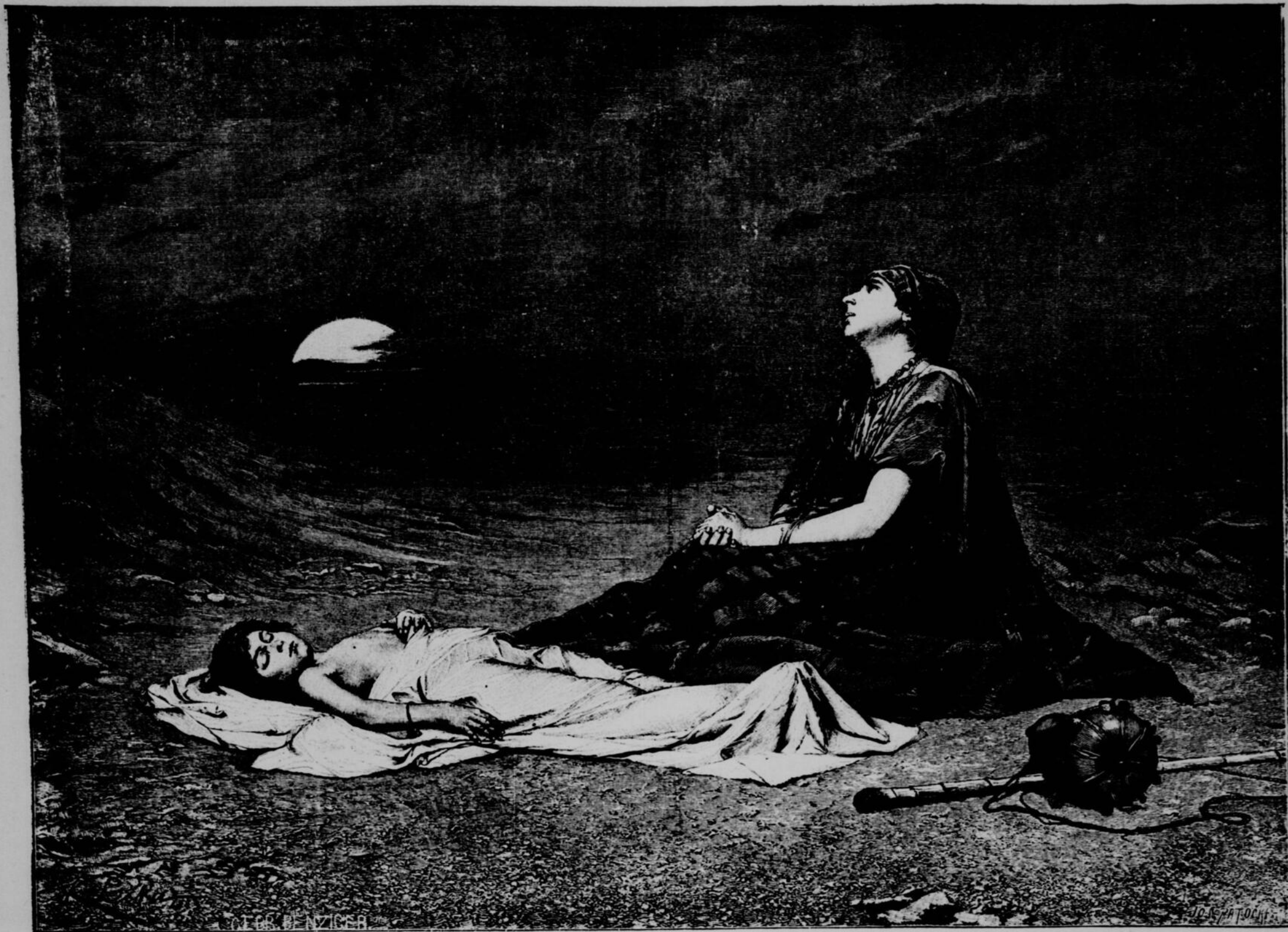
AGAR ET ISMAEL DANS LE DESERT. — TABLEAU DE M. LISKA