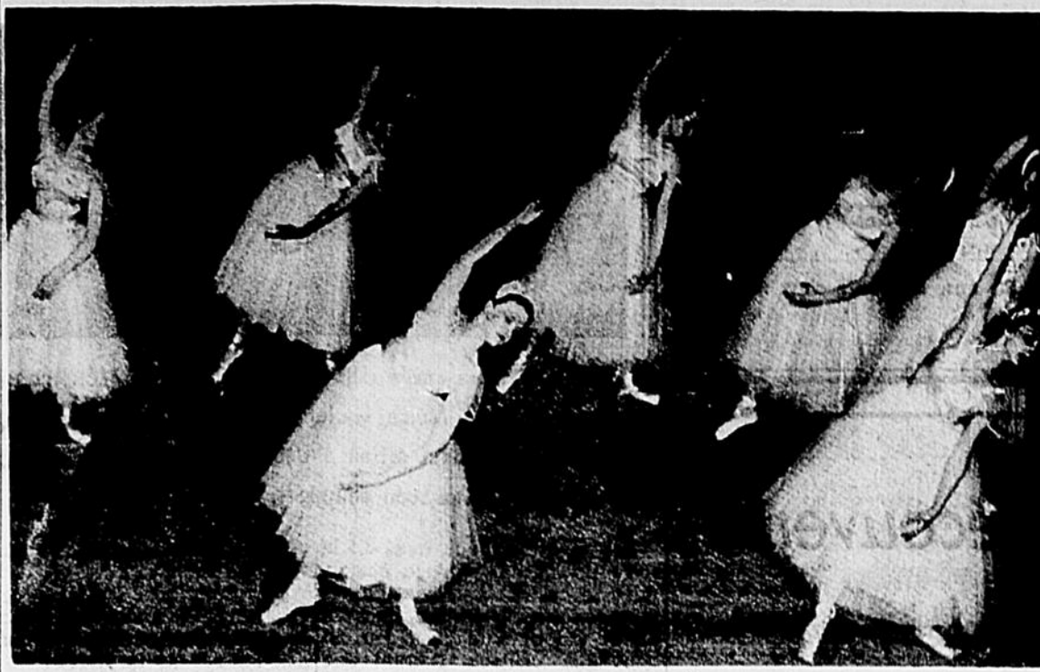
Le grand soir du sixième spectacle annuel du Corps de Ballet Maskoutain approche de plus en plus. C'est en effet le 26 courant que ce spectacle sera offert à la population, au Théâtre Le Paris. On nous annonce qu'une représentation sera offerte pour les enfants, à 3.30 heures p.m., le jour même. Ceux qui désirent des billets voudraient bien se les procurer au plus tôt, à la Pharmacie Locas. Sur notre photo, nous voyons un groupe de danseuses que nous aurons le plaisir d'applaudir mardi soir prochain.