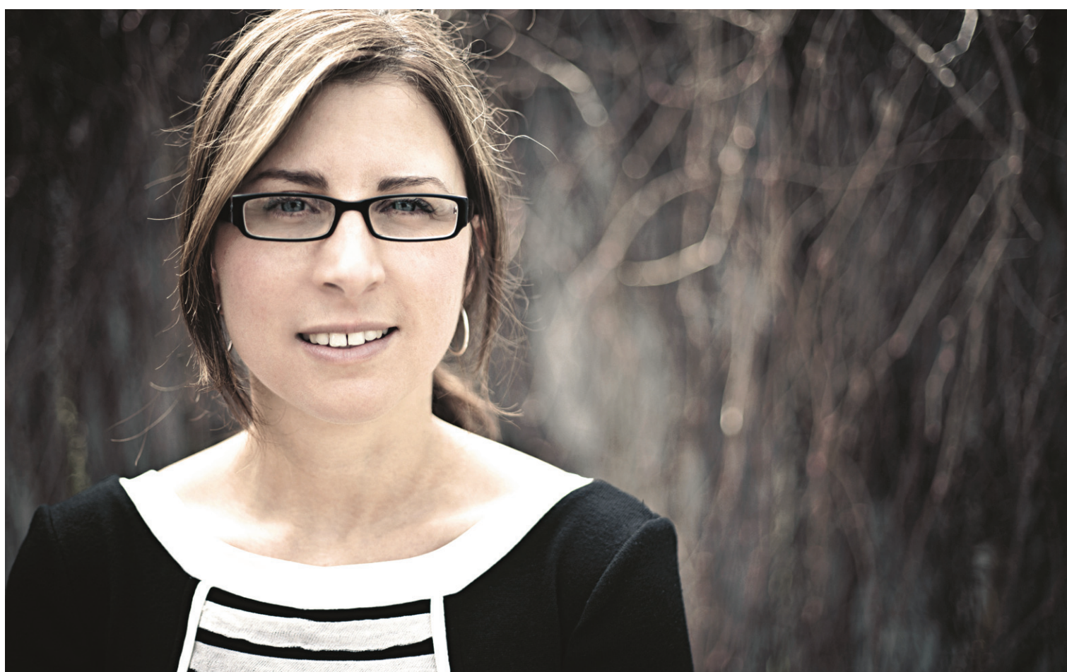
Saccades, de Maude Poissant, regroupe 11 nouvelles écrites dans un style clair, sans fioriture.

Voilà l'extrait d' Apostrophes ou Charles Bukowski, ivre, quitte le plateau ledevoir.com