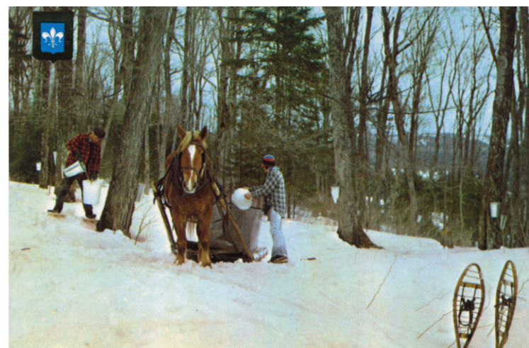
La carte postale dont Mathieu Arsenault s'est inspiré.

tourne-sols fanés et des pissen-lits d'un pied de haut qui ramassent la rosée et une affiche détrempée du festival de tir de tracteur et une carcasse d'autobus de canicule et conduire une demi-heure sur des chemins de terre pour aller payer sa corde de bois dans une maison sans revêtement et tardif terrassement les équipements de ferme thérien les assurances gilles la voie annoncés sur un napperon de restaurant plié en éventail. Notre takeout indien sentirait l'huile à mouche, nous ferions du quatre-roues des heures de temps dans le bois climatisé des salles les plus plates de la col-