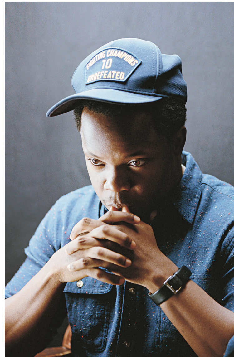
AUTUMN DE WILDE

D Voir • Le making of du dernier disque d'Ambrose Akinmusire ledevoir.com/musique