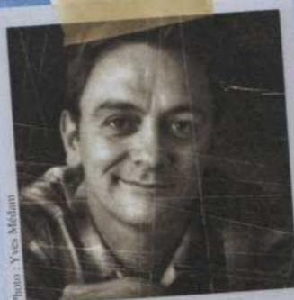
Michel Marc Bouchard

Michel Marc Bouchard est l'un des dramaturges québécois les plus importants des deux dernières décennies. En 1987, il obtient son premier succès public avec la création de la pièce Les Feluettes ou la répétition d'un drame romantique par le Théâtre Petit à Petit, en coproduction avec le Centre national des arts, dans une mise en scène d'André Brassard. Ce sera le début d'une carrière internationale pour l'auteur qui, à ce jour, a écrit plus de 25 pièces, traduites en plusieurs langues, publiées en français, en anglais, en allemand, en italien et en espagnol. Ses œuvres sont jouées partout dans le monde, notamment en France, en Angleterre, en Suisse, aux États-Unis, au Pérou, au Japon et au Mexique. Parmi ses œuvres théâtrales les plus connues, mentionnons Les Muses orphelines (1988), Le Voyage du couronnement (1994) et Le Chemin des Passes-Dangereuses (1998). Acclamé par ses pairs et par la critique, il rejoint un très vaste public par ses drames, mais aussi par ses comédies, pensons à Les Grandes chaleurs (1991), Le Désir (1995) et Pierre, Marie... et le démon (1997). Il enseigne à l'École nationale de Théâtre du Canada, à l'Université du Québec à Montréal et à l'Université d'Ottawa, en plus d'être maître d'œuvre d'importantes expositions thématiques. Il a conçu l'exposition Tous ces livres sont à toi pour l'ouverture officielle de la Grande Bibliothèque de Montréal. Il travaille présentement à l'écriture d'une adaptation cinématographique de sa pièce Les Grandes chaleurs.