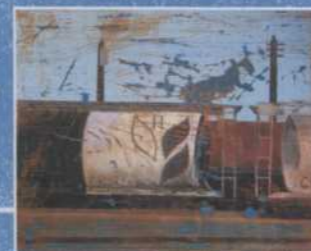
La piste cyclable des trains