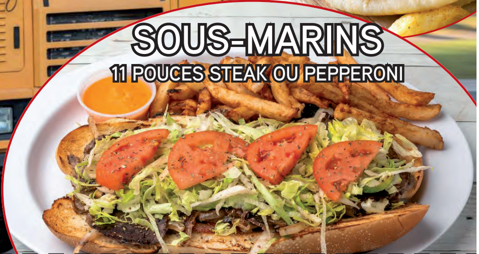
SOUS-MARINS 11 POUCHES STEAK OU PEPPERONI