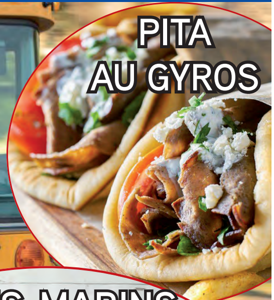
PITA AU GYROS