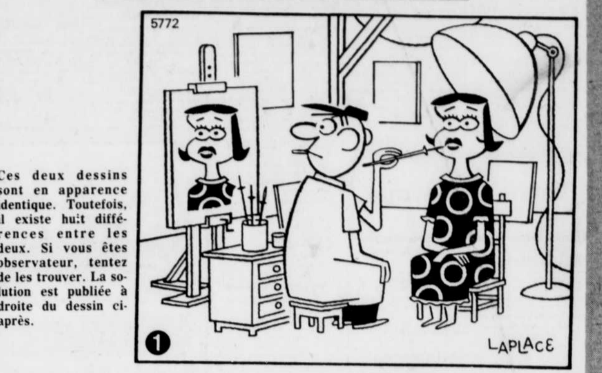
Ces deux dessins sont en apparence identiques. Toutefois, il existe huit différences entre les deux. Si vous êtes observateur, tentez de les trouver. La solution est publiée à droite du dessin ci-après.