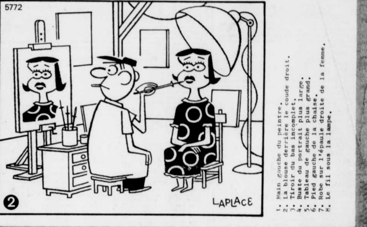
1. Main gauche du peintre. 2. La blouse derrière le coude droit. 3. Tiroir du bas incomplet. 4. Buse du portrait plus large. 5. Tableau de gauche plus grand. 6. Pied gauche de la chaise. 7. Robe sur l'épaule droite de la femme. 8. Le fil sous la lampe.