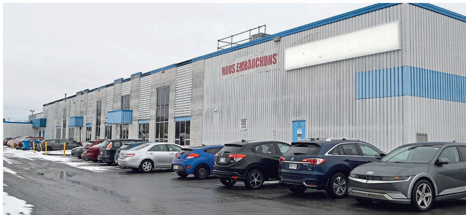
L'usine Gadoua de Napierville cessera sa production à la mi-avril.

Par contre, Sylvain Cazes, l'attaché politique de M me Mallette, indique que des actions pourraient potentiellement être posées par le gouvernement pour éviter la fermeture de l'usine et