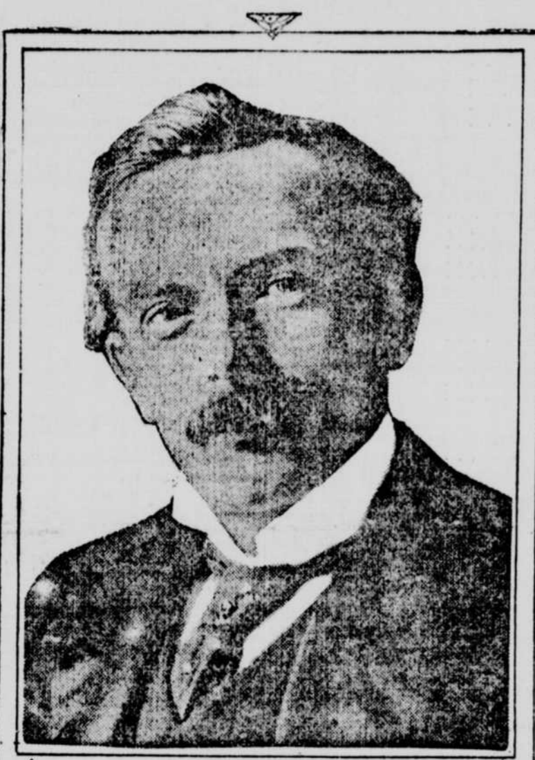
M. LLOYD GEORGE, qui succède à M. Asquith, à la tête du cabinet d'Angleterre.

Quels seront le ministre des Affaires Etrangères et le chancelier de l'Echiquier — deux des postes les plus importants en dehors des sphères militaires et de la marine — est une question de spéculation sur laquelle toute prédiction est incertaine. La Chambre des Communes se réunira demain, mais on n'attend aucun avis concernant le nouveau gouvernement. Une note officielle disait ce soir que les procédures seront formelles et qu'on ne répondra à aucune question.