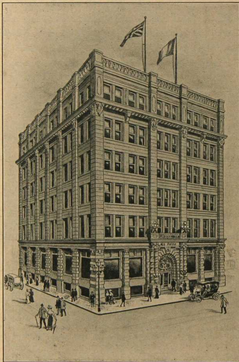
CETTE VIGNETTE REPRESENTA LE NOUVEL EDIFICE DE " LA PATRIE "

Le grand organe des Canadiens-Français, qui donne à ses clients d'annonces une circulation quotidienne de plus de 45,000 copies :: :: :: :: ::