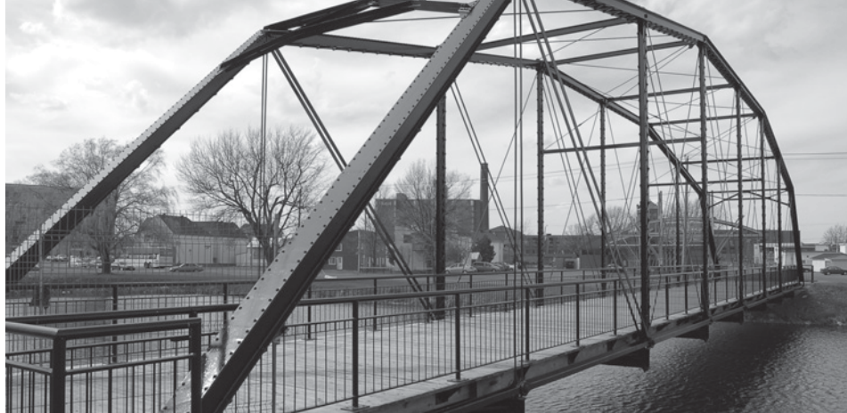
Pont Jean-De La Lande

Le 9 novembre 2011, en compagnie de professionnels de la Direction du patrimoine et de la muséologie du Ministère, les commissaires ont pu se familiariser avec les lieux de l'agrandissement et de la rénovation de l'Hôtel-Dieu de Québec.