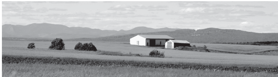
Arrondissement historique de l'Île-d'Orléans Louise Leblanc

Enfin, le Conseil poursuivra ses visites de familiarisation dans les diverses régions du Québec. Ces visites sont importantes puisqu'elles permettent aux membres de la Commission de mieux connaître et comprendre les enjeux locaux et régionaux en patrimoine de manière à formuler au ministre des avis éclairés, basés sur la connaissance.