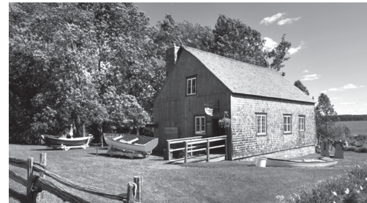
Chalouperie Godbout, arrondissement historique de l'île-d'Orléans Louise Leblanc

La Commission a adhéré à la Stratégie gouvernementale de développement durable en adoptant un Plan d'action de développement durable qui s'étend sur cinq ans. La présente rubrique fait état des actions menées et des résultats obtenus au cours de l'année, selon les indicateurs retenus et les cibles visées.