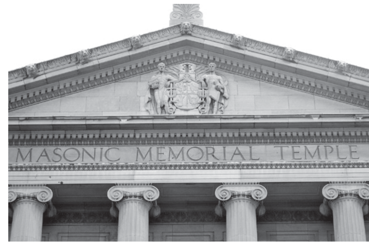
Temple maçonnique de Montréal