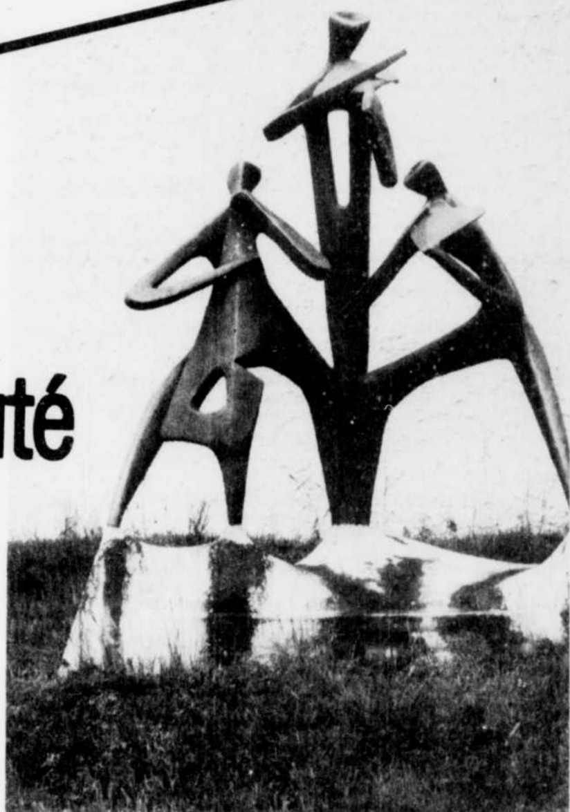
Le Centre d'art Orford, comme son sigle l'indique, promet cet été un programme musical encore plus riche que jamais.

Selon M. Rolland, le niveau très avancé des étudiants inscrits cette année aux stages permet d'espérer un été extrêmement enrichissant.