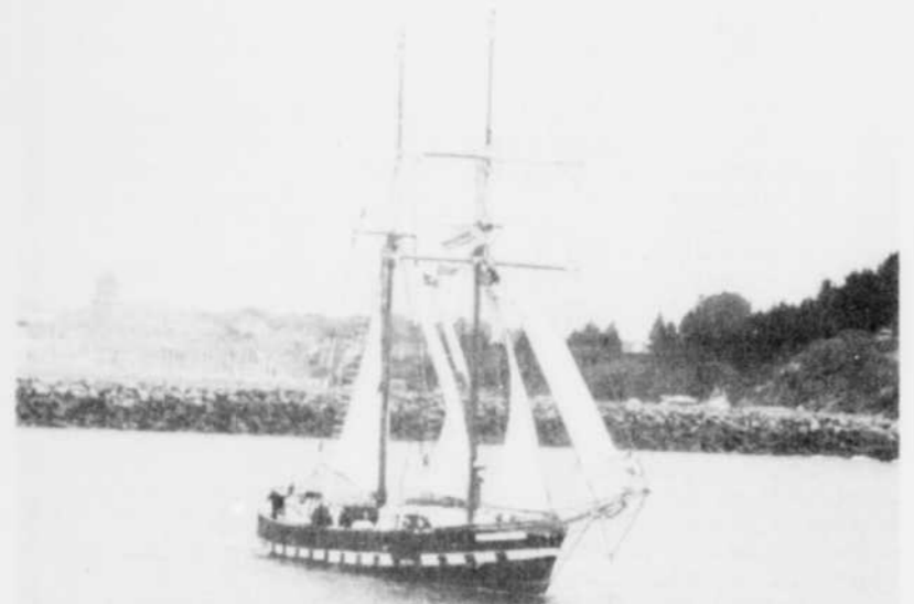
Le Jacques Cartier, qui est commandé par Uniprix, quitte ici sa mère patrie, Saint-Malo, avec pour prochain escale le Québec.