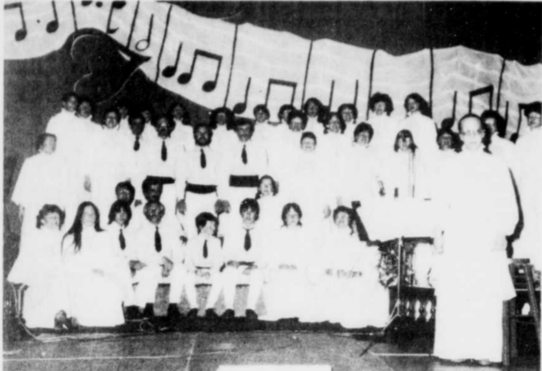
Pas moins de 56 choristes, huit musiciens, un comédien et une équipe technique, composent la troupe La Farandole qui en est à sa 13e année d'existence.