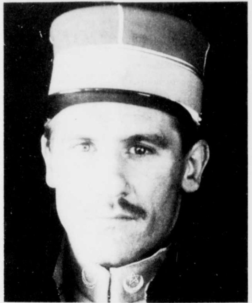
Gérard Depardieu tient le rôle du lieutenant Charles Saganne dans le film d'Alain Corneau.

Lorsqu'il vient à Paris pour suivre les cours de l'IDHEC, le cinéma prend définitivement le pas sur la musique. Il ressort de l'Institut des Hautes Etudes Cinématographiques avec deux diplômes.