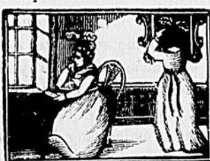
CUNÉGONDE CHEZ MADAME BELTAPET

La servante devait faire la cuisine et le lavage de la maison, répondre à la porte et raccommoquer le linge à ses moments perdus.