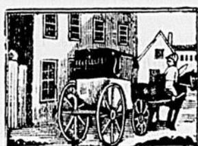
LA JUMENT ET LA VOITURE

Il avait une petite jument qui dans son jeune temps pouvait trotter en 2 40. Sa voiture était de l'ancien style.