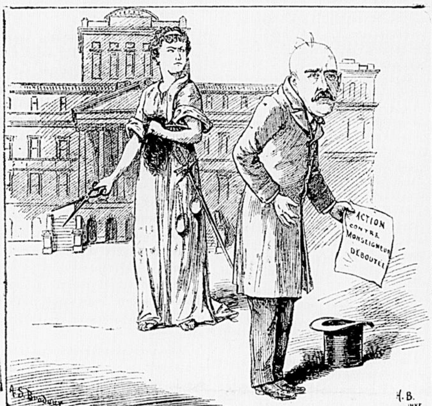
Le Jugement contre le "Canada-Revue"

L'alliance de Beltapet avec la famille des Trouignons lui ouvrit la porte des salons les plus aristocratiques du Beaver Hall Canadien. Madame Beltapet était de toutes les fêtes ; elle assistait aux bals et aux five o'clock