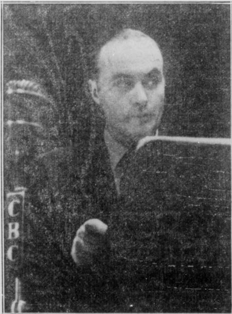
CHARLES BOYER attend la réplique! Une pose caractéristique du grand artiste croquée sur le vif au cours d'une répétition de la seconde émission de l'Emprunt, diffusée par les postes de Radio-Canada.