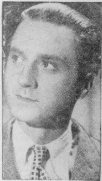
artiste du cinéma français dans une pièce "L'Élévation" de Bernstein