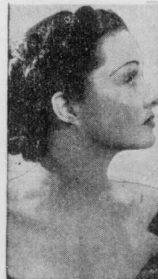
artiste de cinéma