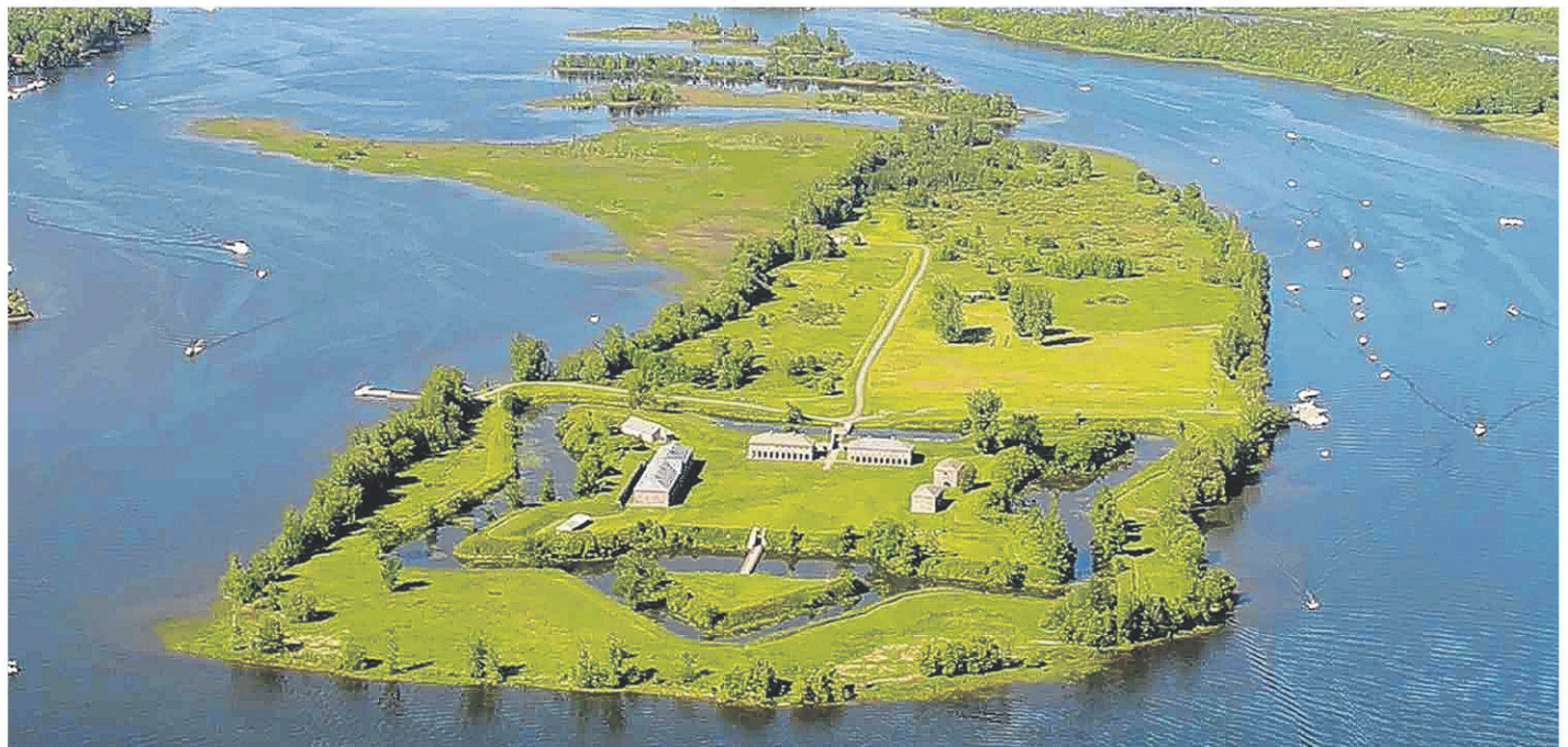
Ottawa injectera 38,2 M$ dans ses trois sites de la région, dont à Saint-Paul-de-l'Île-aux-Noix.

Parcs Canada prévoit consacrer 3,55 M$ au Fort Chambly, notamment pour la protection du rivage et la stabilisation de la maçonnerie.