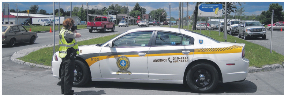
Le bilan routier s'est amélioré dans la MRC des Jardins-de-Napierville.

Le bilan routier recense 496 collisions, contre