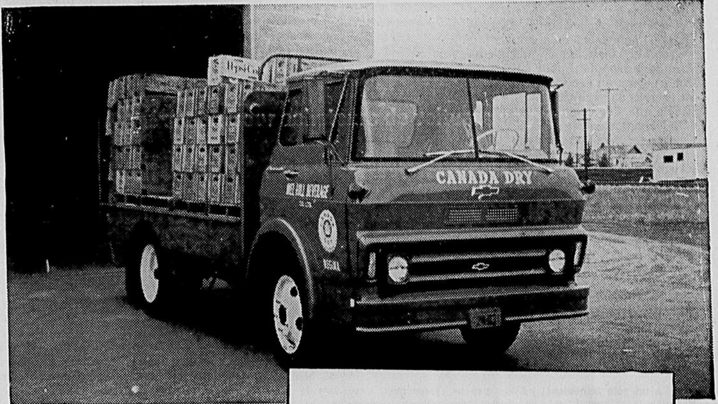
UNE VALEUR GENERAL MOTORS

La libération de la liberté signifie le libre refus d'un homme à être libre, c'est-à-dire à être homme.