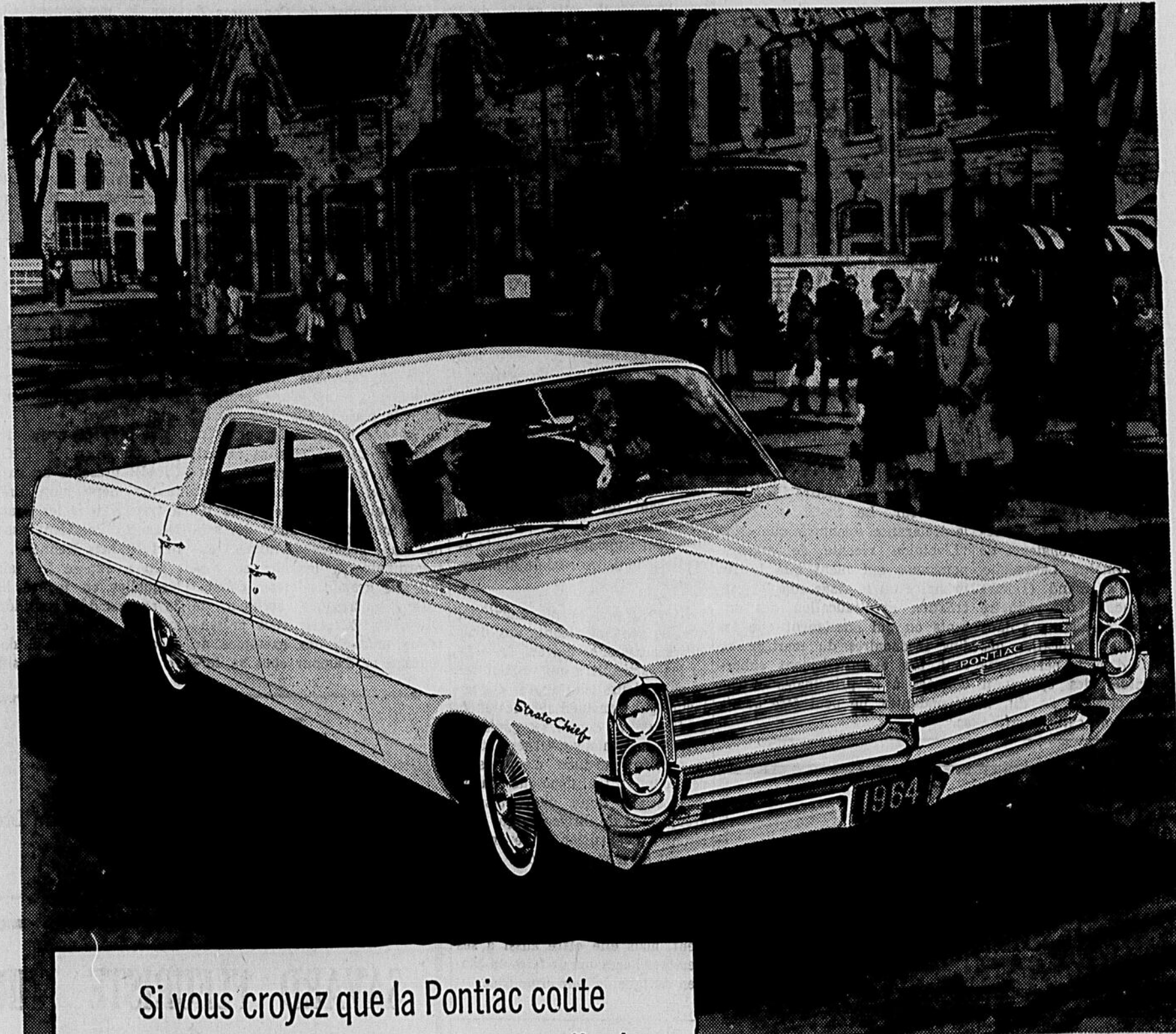
UNE VALEUR GENERAL MOTORS Sedan Strato-Chief, 4 portes

Si vous croyez que la Pontiac coûte beaucoup plus cher que les voitures ordinaires VOUS ALLEZ DEVOIR CHANGER D'AVIS!