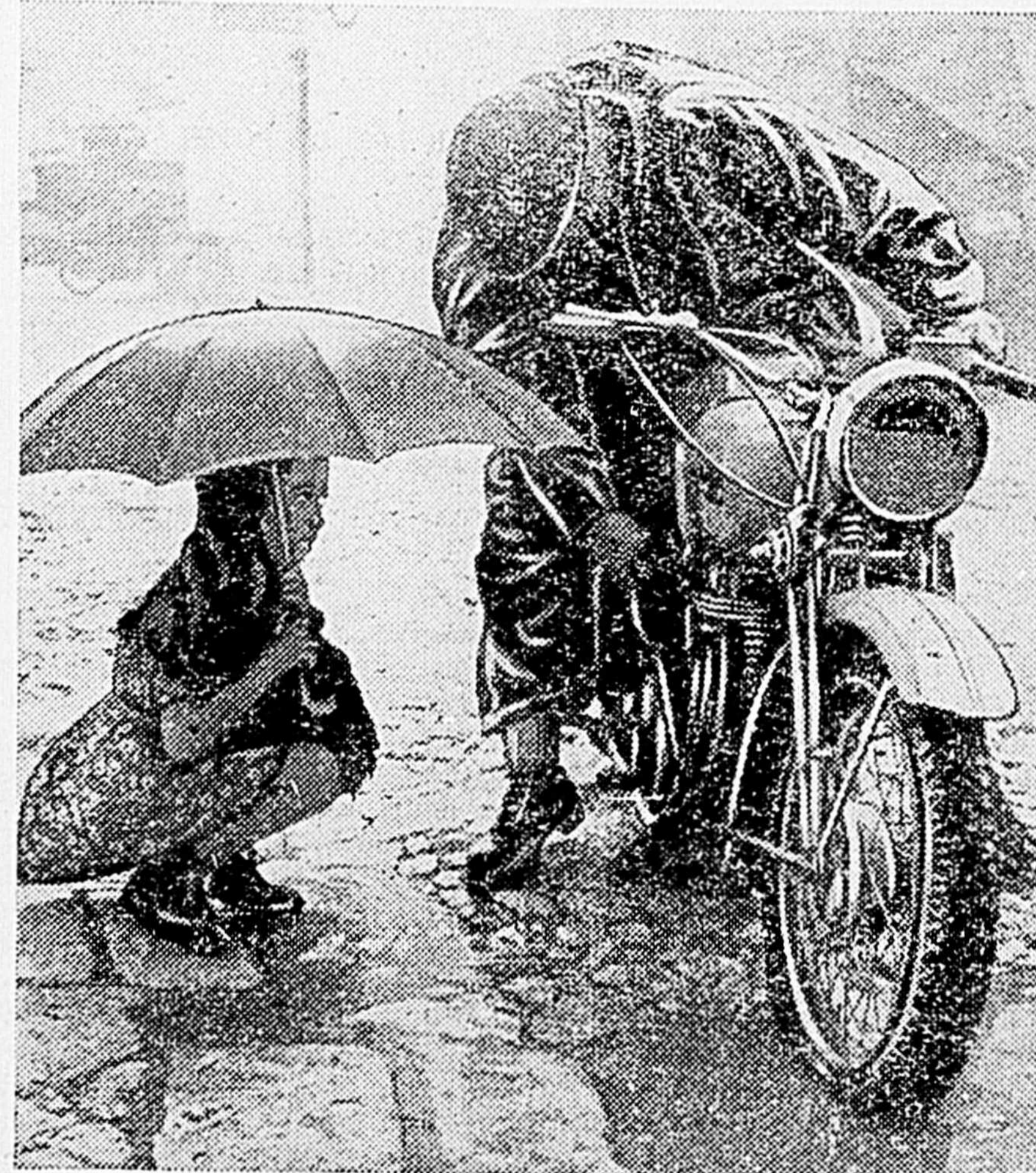
Des pluies abondantes ont compliqué la tâche de la 5e et de la 8e armées en Italie, mais n'ont pas empêché ces armées d'avancer vers Rome. Les averses n'ont pas rafraîchi l'inévitable curiosité des civils. La photo montre une estafette arrêtée par un engorgement de son carburateur. Une petite Italienne regarde, à l'abri d'un gros parapluie.