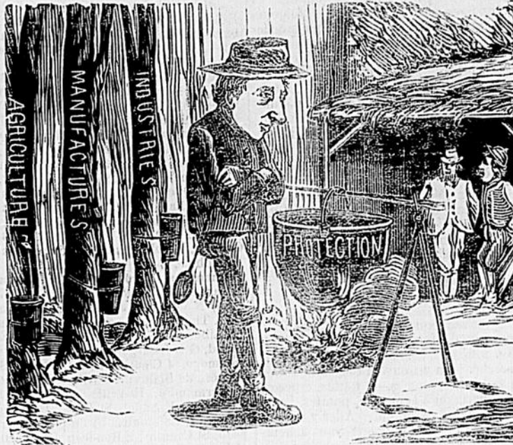
JOHNNY AU SUCRE.

CEUX qui souffrent ne peuvent pas raisonnablement hésiter d'essayer le Vin de Quinine de Campbell.