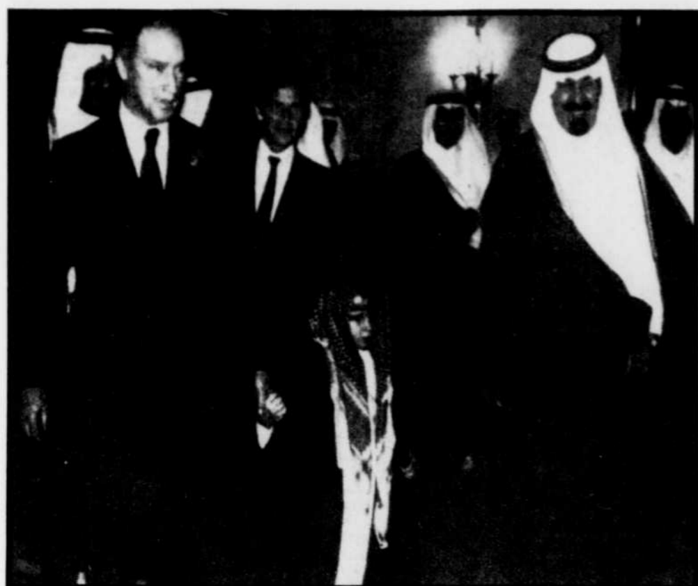
Le roi Kalid a accueilli le premier ministre canadien, Pierre Trudeau, et son fils de six ans, Sacha, vêtu du traditionnel costume arabe, lors d'une visite de trois jours en Arabie saoudite.