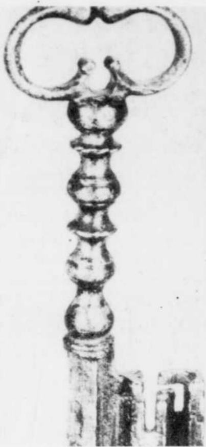
Un véritable bijou, une clé française réalisée au XVIIIe siècle dans l'acier.

par Pierrette Roy Tout le savoir-faire, la finesse de travail et d'exécution des anciens serruriers et ferronniers est présente dans cette exposition consacrée à "L'art du serrurier et du ferronnier" que présente actuellement et jusqu'au 30 novembre le Centre d'exposition Léon Marcotte de la rue Frontenac à Sherbrooke.