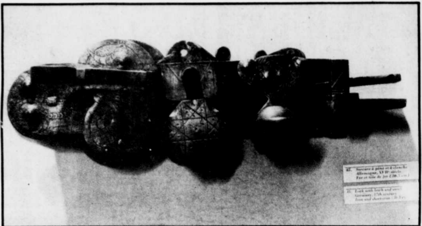
Une magnifique serrure à pêne et à clenche réalisée dans le fer et la tôle de fer en Allemagne, au XVIIe siècle.

C'est là une exposition très impressionnante, qu'il ne nous est pas donné souvent d'apprécier à Sherbrooke et qui, dit-on, se compare avantageusement aux collections européennes du genre; même que certaines des pièces qu'elle présente sont parmi les œuvres les plus remarquables de leur période!