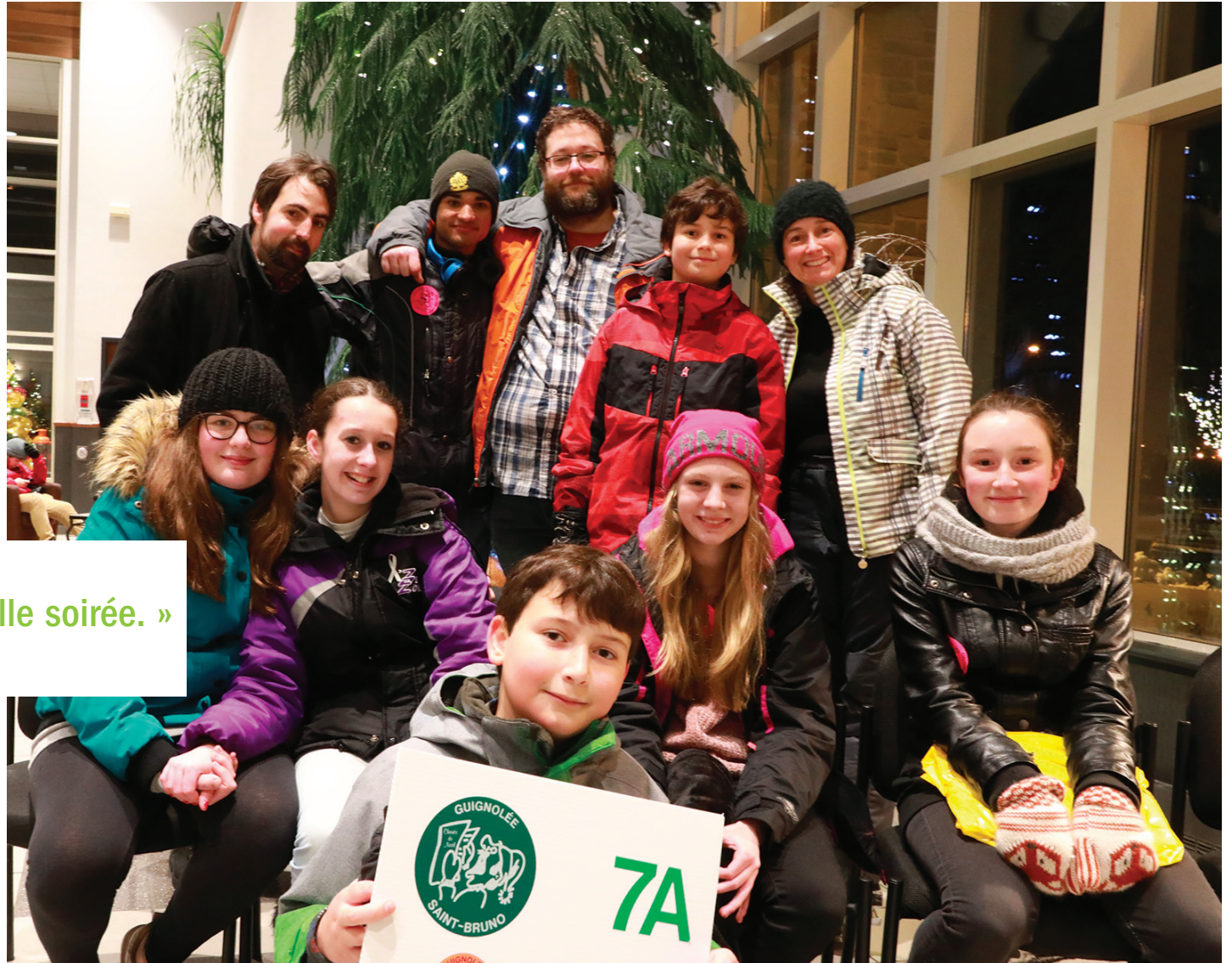
Plusieurs jeunes s'impliquent lors de la Guignolée.

Des petits groupes ont fait du porte-à-porte dans le secteur qui leur avait été désigné. Si personne ne répondait au passage des bénévoles, des enveloppes étaient laissées pour que chacun ait la chance de contribuer. Les gens peuvent donc encore effectuer des dons en argent, jusqu'au début de l'année 2019. L'objectif global est d'obtenir