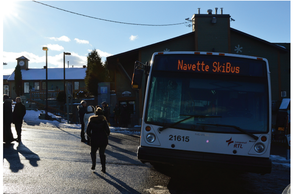
Le RTL a calculé une moyenne de 125 déplacements par fin de semaine en 2018 pour SkiBus.

Rappelons que SkiBus est un service gratuit qui part de la station de métro à Longueuil et qui fait également plusieurs arrêts à Saint-Bruno. Il permet d'apporter à