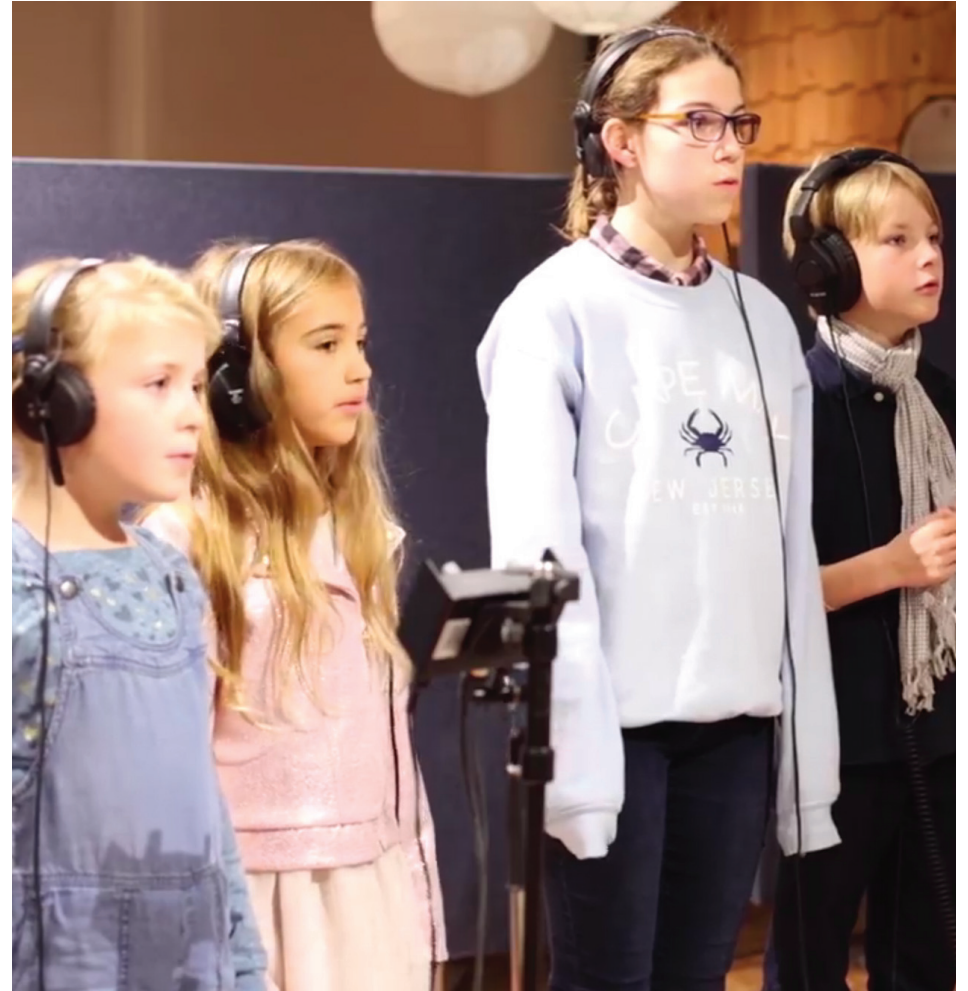
Les élèves ont eu la chance de participer à la vidéo promotionnelle.

Cet automne, des choristes de l'École De Montarville à Saint-Bruno-de-Montarville ont participé à la cause des enfants malades.