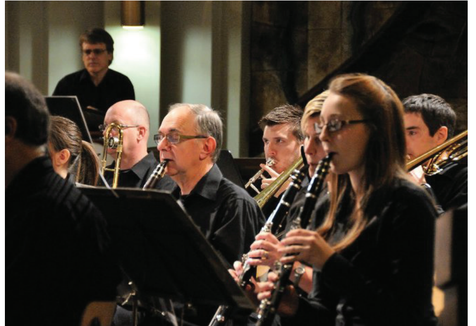
Le concert aura lieu le dimanche 16 décembre à 19 h 30 à l'église Saint-Bruno.

L'Harmonie Mont-Bruno performera lors de son prochain concert « France classique » à l'église Saint-Bruno le 16 décembre.