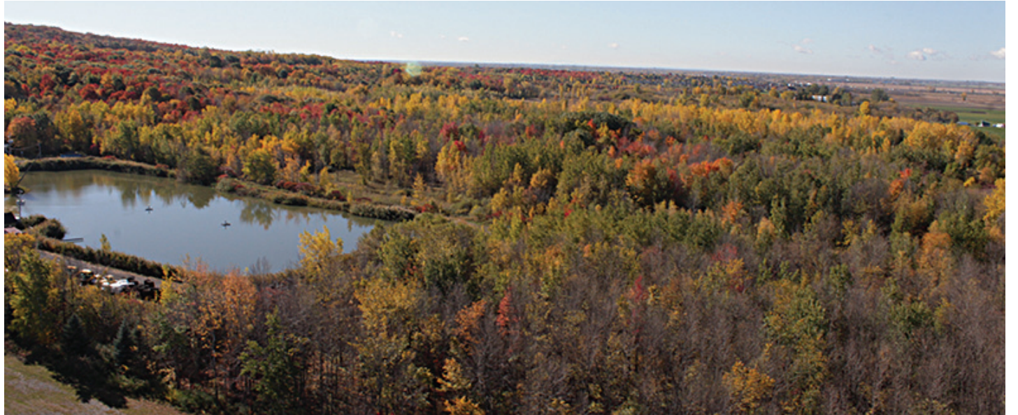
La superficie du parc national du Mont-Saint-Bruno pourrait s'agrandir.

Après avoir annoncé l'année dernière son intention de se défaire de son ancien champ de tir d'une superficie de 4,4 km 2 , le ministère de la Défense nationale se fait presser par les élus de la Communauté