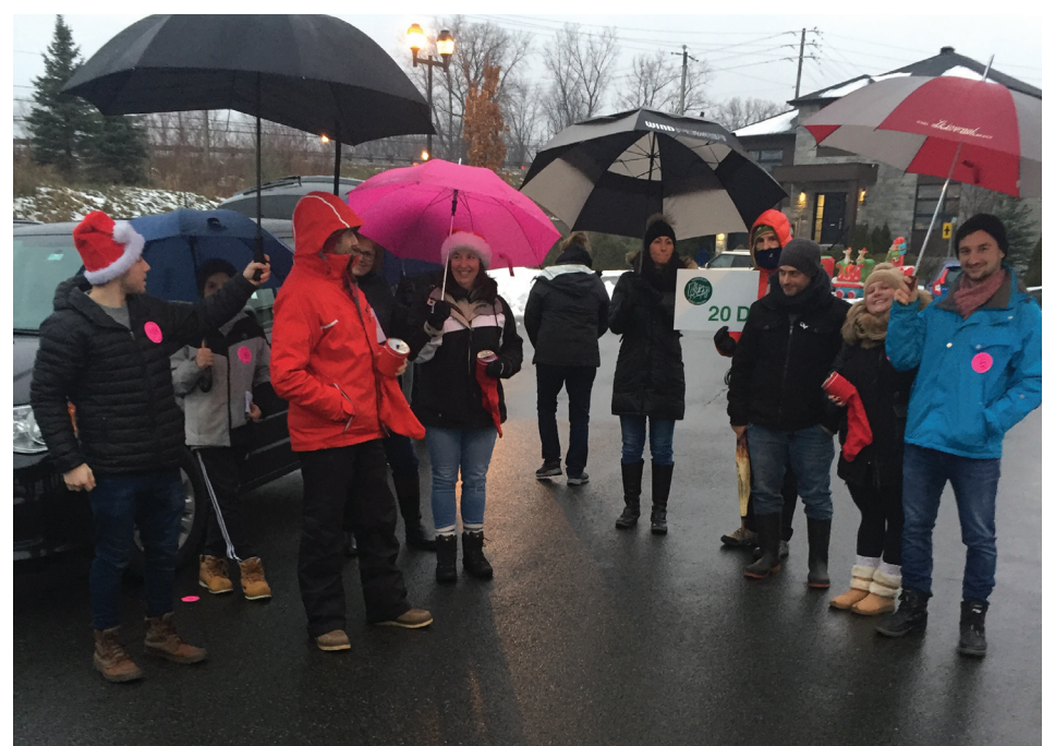
L'équipe des Versants lors de la Guignolée de la paroisse.

La générosité des gens était encore une fois au rendez-vous.