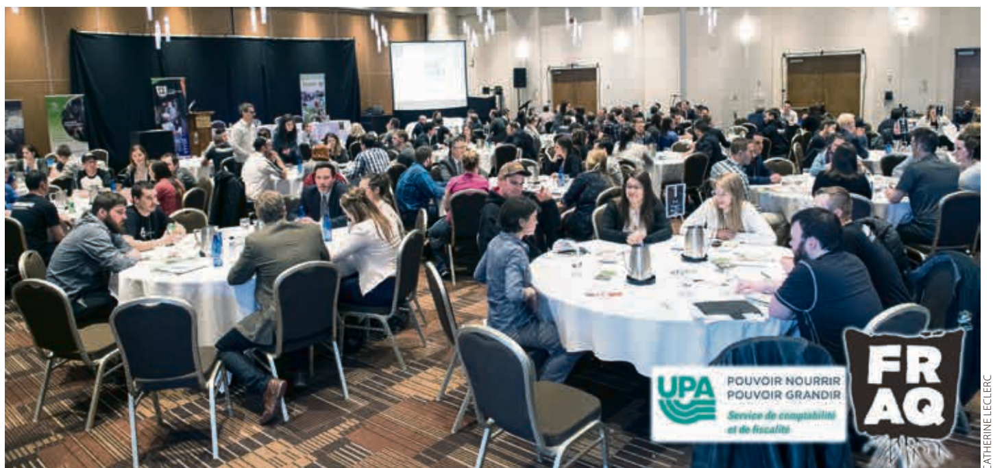
Merci à toutes les organisations qui ont participé à l'activité et y ont apporté leur soutien financier.

Près de 170 délégués, membres et invités étaient réunis pour la deuxième édition des rencontres éclair. Cet atelier a donné lieu à des échanges fructueux entre les relèves présentes et une vingtaine d'organisations du domaine agricole. Un total de cinq rondes de huit minutes ont permis des discussions au terme desquelles les relèves repartaient mieux renseignées sur les différents services offerts dans leur milieu. Encore une fois, l'activité a été un succès à répéter si l'on se fie aux commentaires recueillis auprès des participants. Cet atelier était une présentation du Service de comptabilité et de fiscalité de l'Union des producteurs agricoles (SCF-UPA).