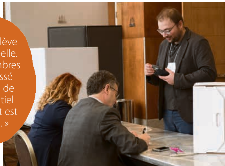
Les membres ont pu exprimer leur vote à la présidence.

« La force de la relève agricole est bien réelle. Le nombre de membres de la FRAQ est passé à 1 849, en hausse de 19 %. Notre potentiel de développement est encore immense. »