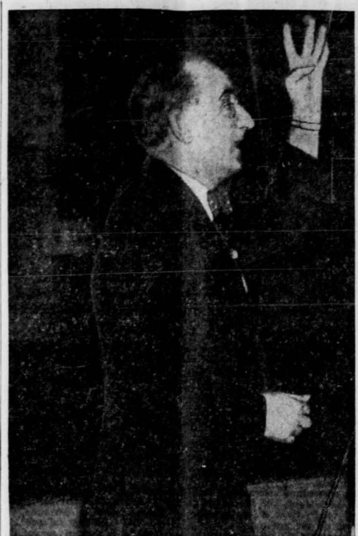
M. Joseph Smallwood, premier ministre intérimaire de Terre-Neuve annonce la date de la première élection provinciale depuis 17 ans, dans la nouvelle province du Canada. L'élection aura lieu le 27 mai. La nouvelle a été annoncée au cours de la convention du parti libéral à Terre-Neuve, qui a choisi M. Smallwood comme leader provincial.

M. Houde appuie le travail accompli par les salustiens, en qui il se plaît à louer un grand esprit de civisme.