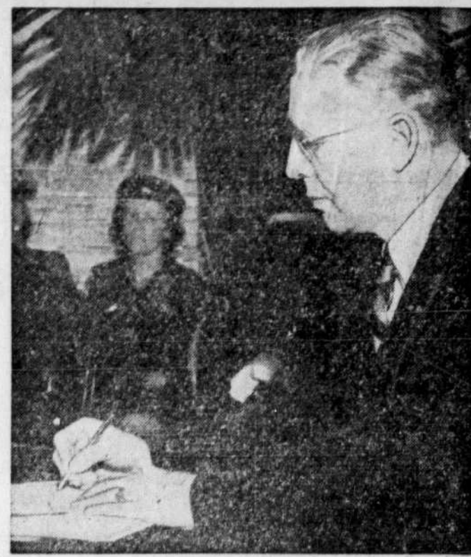
Le nouveau premier ministre d'Ontario, M. Leslie M. Frost, qui a été choisi leader provincial du parti progressiste-conservateur dans cette province, a été assermenté hier, comme premier ministre. On voit ici le premier ministre Frost, comme il apposait sa signature à la cérémonie qui s'est déroulée à Queen's Park, hier après-midi.