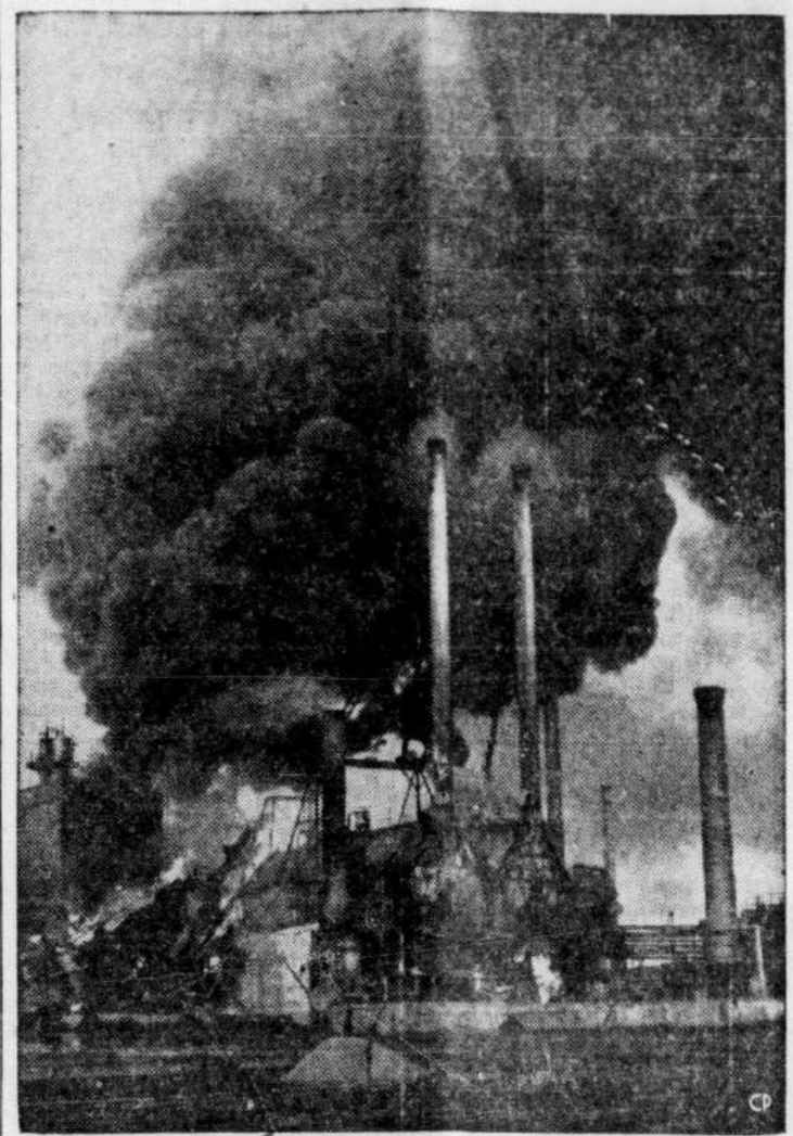
A la raffinerie de l'Imperial Oil, une violente explosion a causé pour $50,000 de dommages. Les édifices de la ville de Regina ont été fortement secoués. On ne connaît pas la cause exacte de l'explosion.