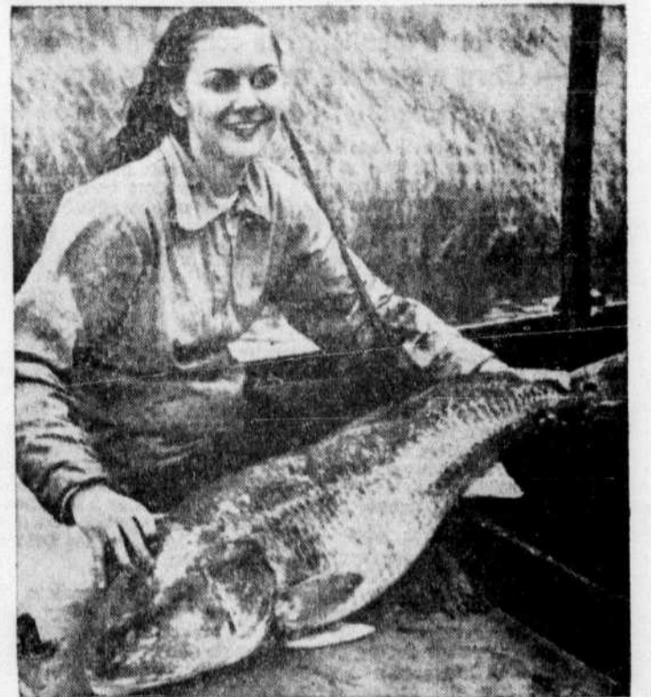
Si l'on a coutume d'admettre que la femme peut pratiquer le sport de la pêche, il n'est toutefois pas naturel à l'orgueil masculin d'avouer que le sexe faible est capable en ce domaine d'exploits qui demandent du biceps, comme la capture de cette perche des cheneaux. Mais, au fait, messieurs, n'auriez-vous pas aimé vous trouver à l'autre bout de la ligne?...