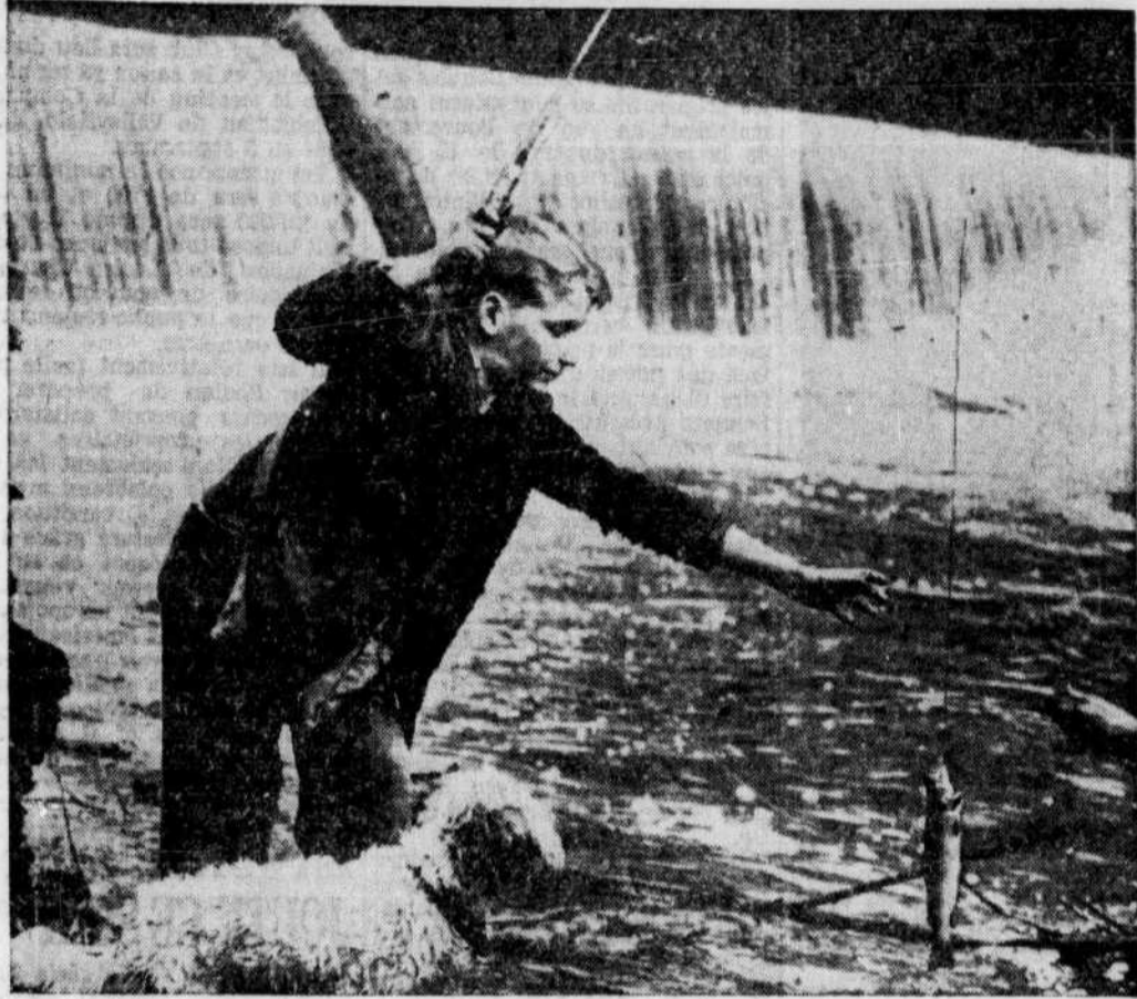
On nous dit que c'est une truite; mais les pêcheurs, surtout les plus jeunes, comme celui-ci, qui verront de semblables pendre au bout de leurs lignes s'imaginent peut-être, dans leur joie, qu'il s'agit d'un saumon, pour le moins. Il est vrai qu'au Canada, la taille de la capture varie constamment, et chaque nouveau récit des exploits de pêche de cha-jamais pour diminuer...