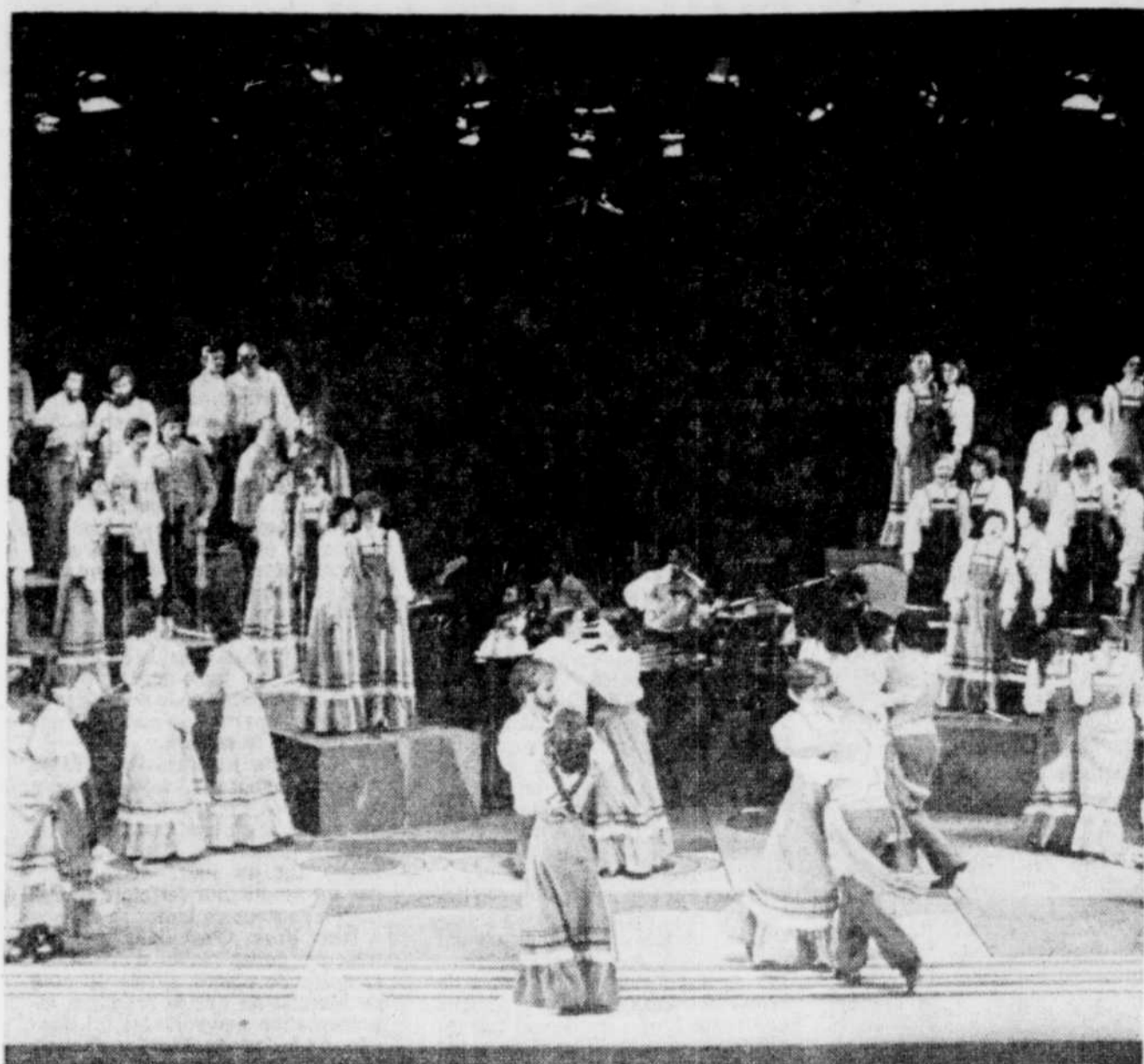
— Quand V'la l'bon vent est sur scène, ça éclate de partout.

Durant les 12 derniers mois, la troupe québécoise n'a surtout pas chômé. Il y a eu d'abord la période de recrutement qui a été particulièrement fructueuse. Vingt gars et filles qui ont permis un