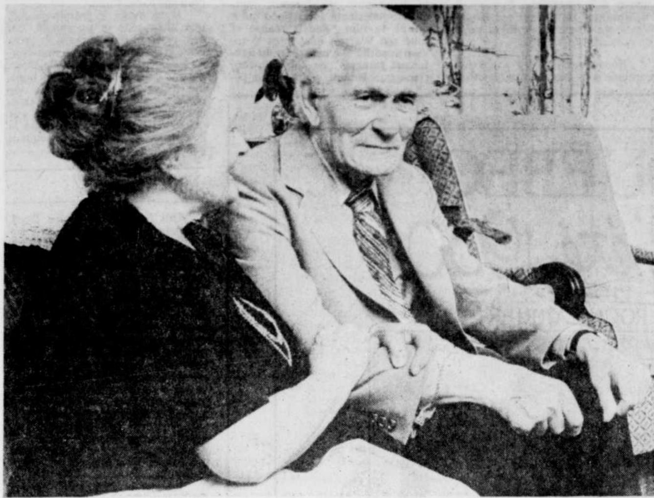
Le Soleil, René St-Pierre