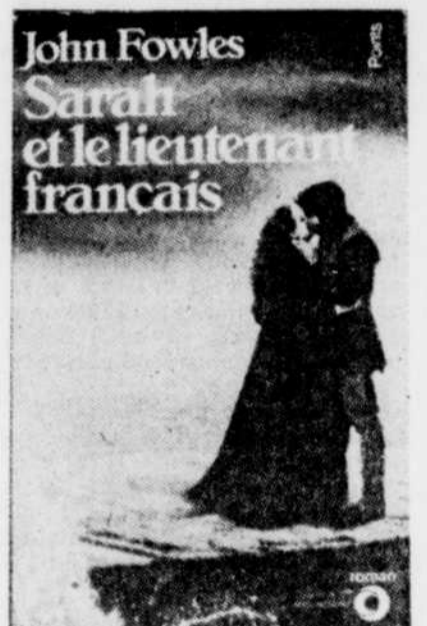
SARAH ET LE LIEUTENANT FRANÇAIS, par John Fowles. Traduit de l'anglais par Guy Durand. Editions du Seuil, collection Points, série roman. 670 pages en livre de poche.

Nous avons déjà raconté le synopsis du film dans ces pages. Rappelons simplement que le lieutenant français n'existe que dans le souvenir de cette femme. Elle a laissé croire à toute une petite ville qu'elle avait une relation intime