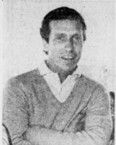
Le Soleil, Jean-Marie Villeneuve