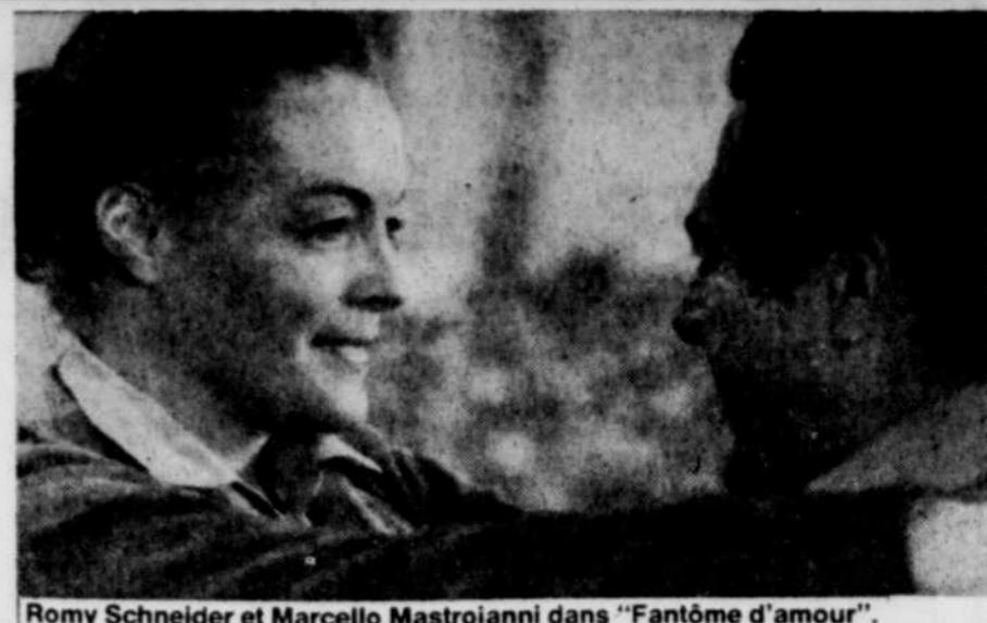
Romy Schneider et Marcello Mastroianni dans "Fantôme d'amour".

été une comédie romantico-romantique à pisser dans ses culottes. Les deux comédiens semblent particulièrement mal à l'aise et en mettent le plus possible pour faire passer cette sauce tomate mal cuite. Il est vrai que le doublage en français médiocre n'aide en rien. Un film de Dino Risi à oublier. Un film à ne pas mettre dans la biographie des deux comédiens.