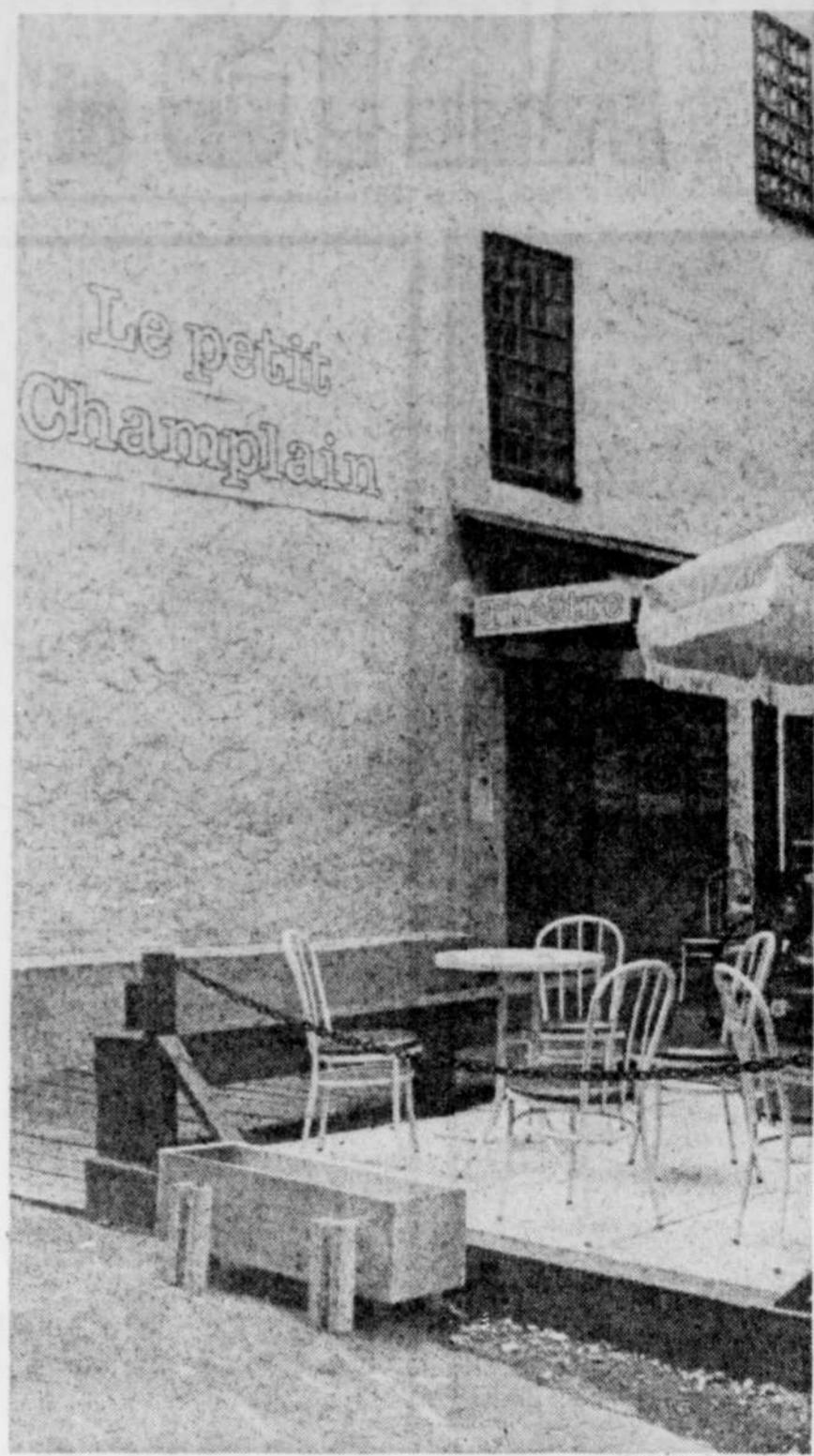
Le Petit-Champlain est un théâtre important dans le milieu.

Le portrait financier du Petit-Champlain est beaucoup moins ré-