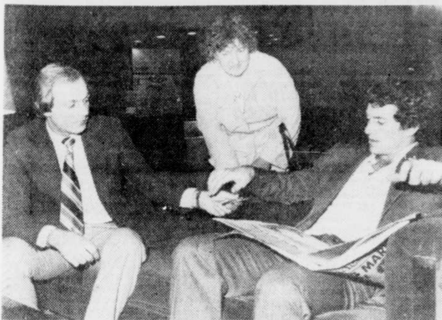
Guy Lafleur (à gauche) et Doug Risebrough du Canadien jouent pour une équipe "ennemie" mais cela n'a pas empêché cette dame de leur demander leur autographe, hier soir, à Québec, à la veille de l'affrontement contre les Nordiques.