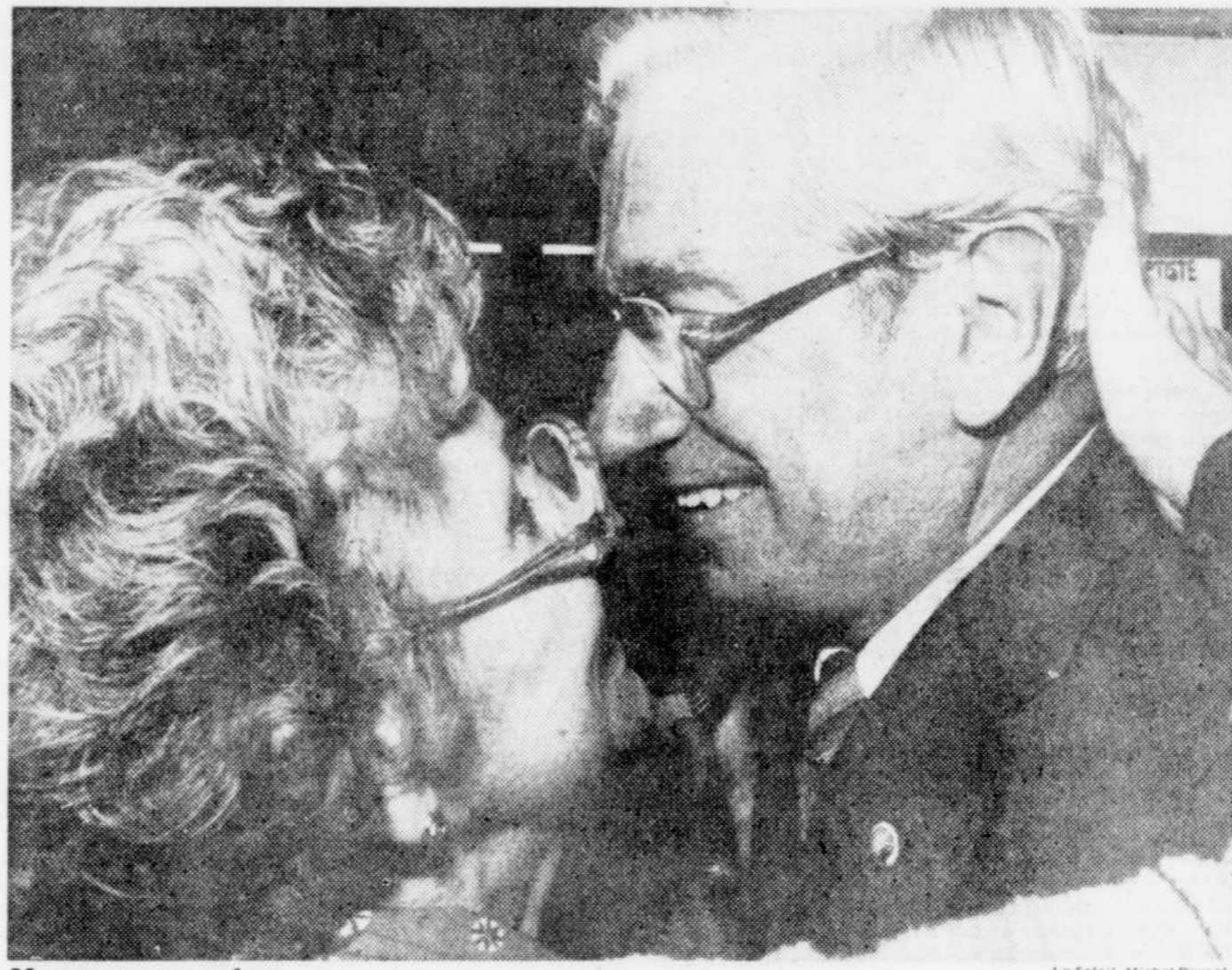
Le Soleil, Michel Parent