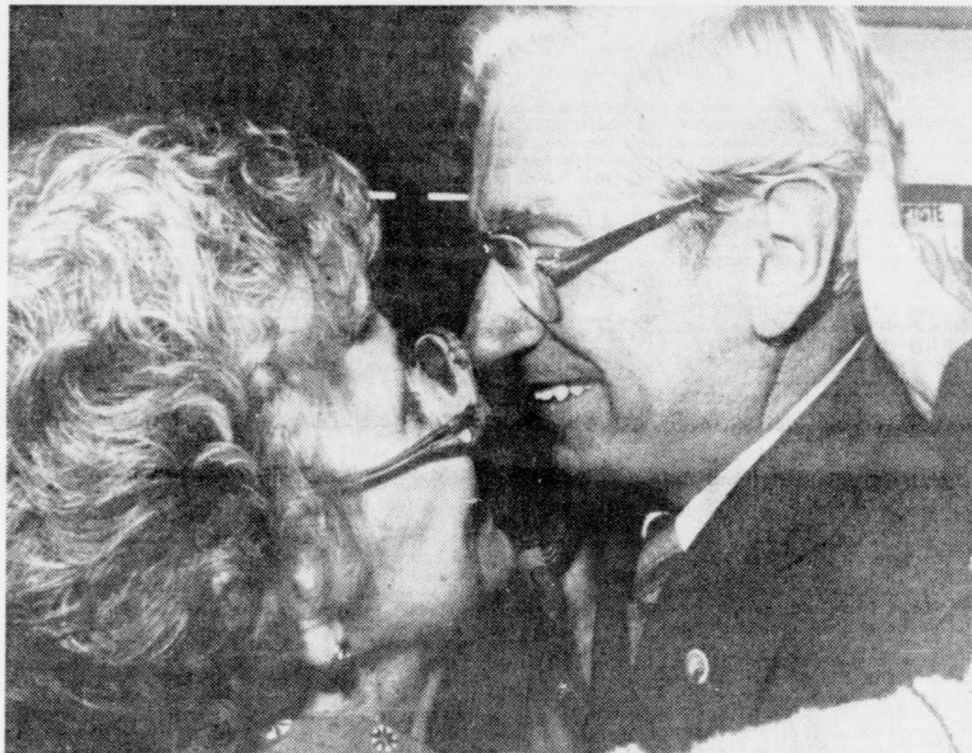
Le Soleil, Michel Parent