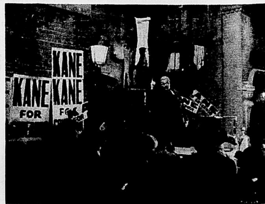
Joseph COTTEN dans « Citizen Kane » d'Orson Welles

Souignons, en terminant, l'art avec lequel Welles se sert de l'éclairage: combien de fois