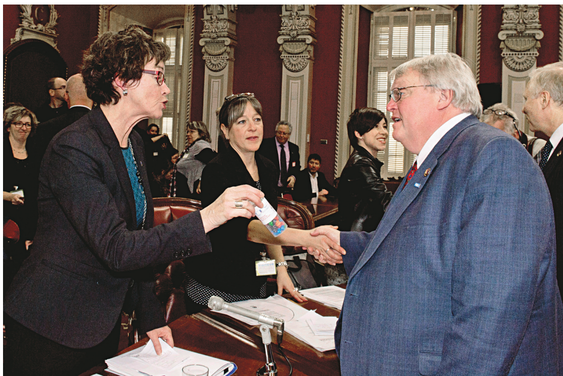
La présidente de la CSQ, Louise Chabot, exhibe au ministre Gaëtan Barrette un contenant de fausses pilules, une posologie nécessaire pour garder son calme face à sa réforme décriée, dit-elle.

Gaëtan Barrette accuse en retour les syndicats de suivre un «agenda politique» en cette