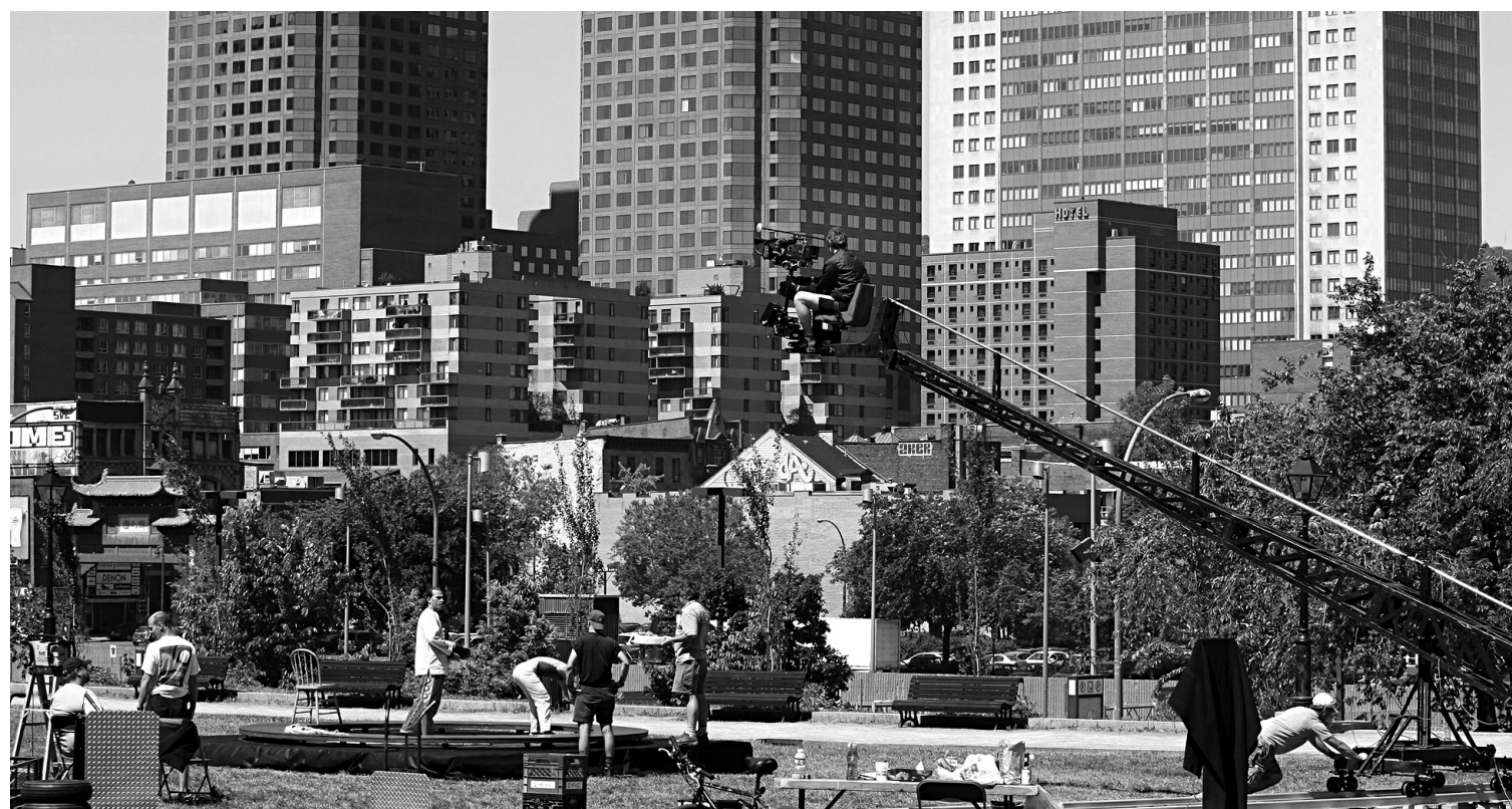
Les studios acquis servent autant à des productions cinématographiques locales qu'étrangères.