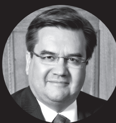
DENIS CODERRE Maire de Montréal Président de la Communauté métropolitaine de Montréal

RÉSERVEZ DÈS MAINTENANT: 514 871-4001 www.ccm.ca/gm-2014