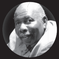
SECTEUR CULTUREL OLIVER JONES