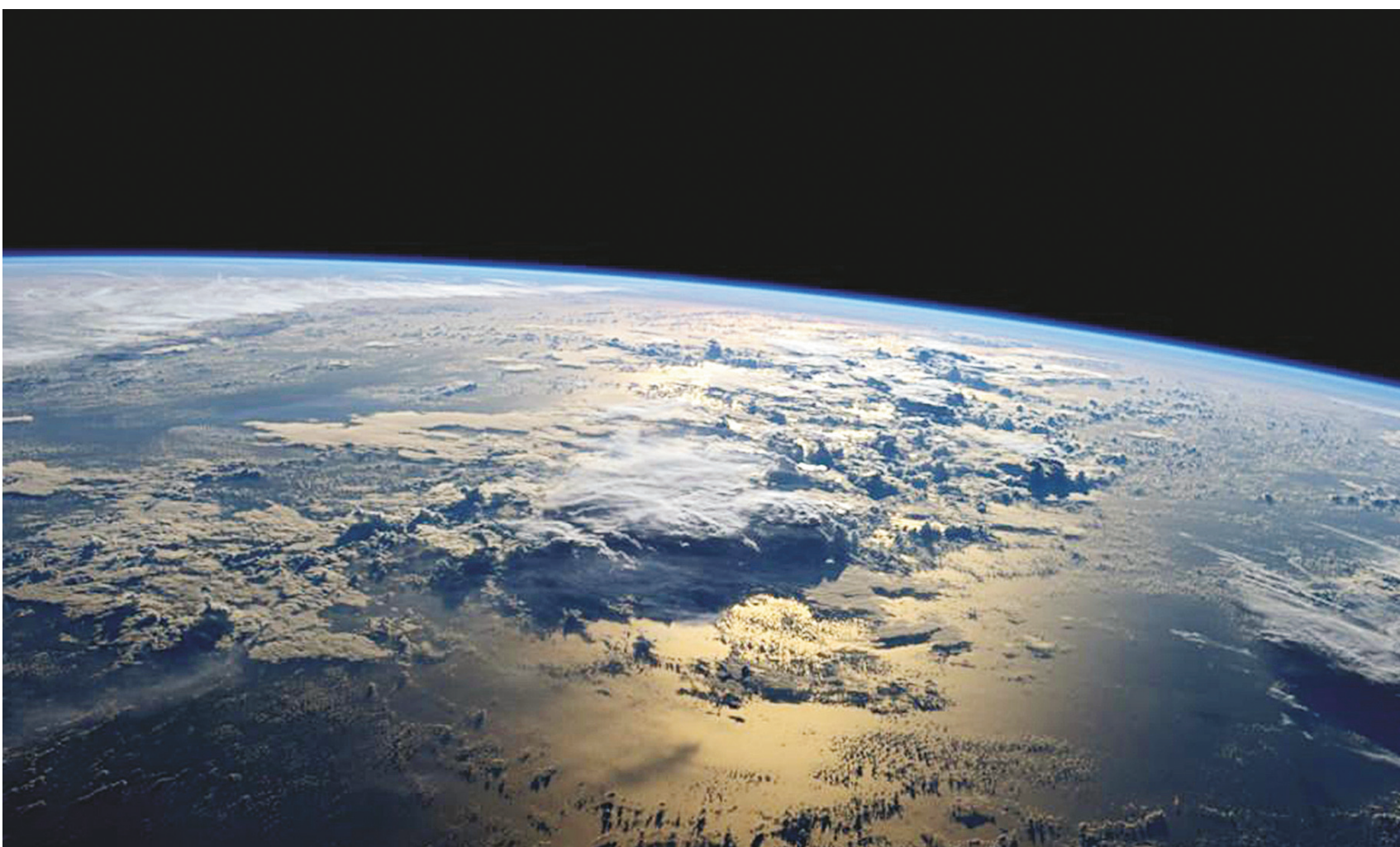
Si la tendance se maintient, la grande majorité pour qui la Terre sera encore la seule et unique option se trouvera en terrain hostile.