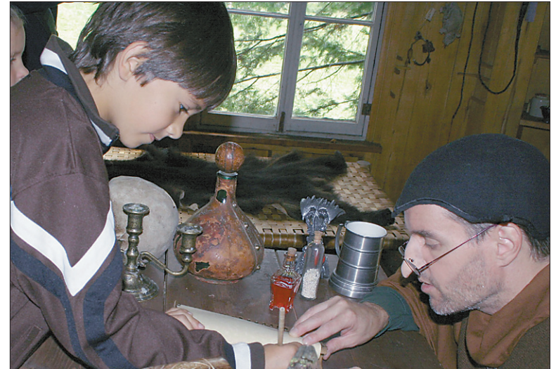
Les responsables du Sanctuaire des Braves ont élaboré un nouveau scénario.

soient adaptés parfaitement aux nouvelles aventures auxquelles prendront part les jeunes Braves, l'aménagement de certains bâtiments a été modifié.