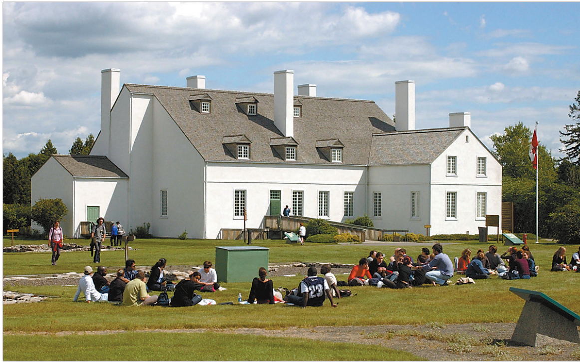
Les Forges-du-Saint-Maurice, un incontournable touristique à Trois-Rivières.

Le Centre d'exposition sur l'industrie des pâtes et papiers (CEIPP) a également beaucoup à offrir. Le Centre expose entre autres comment cette industrie a