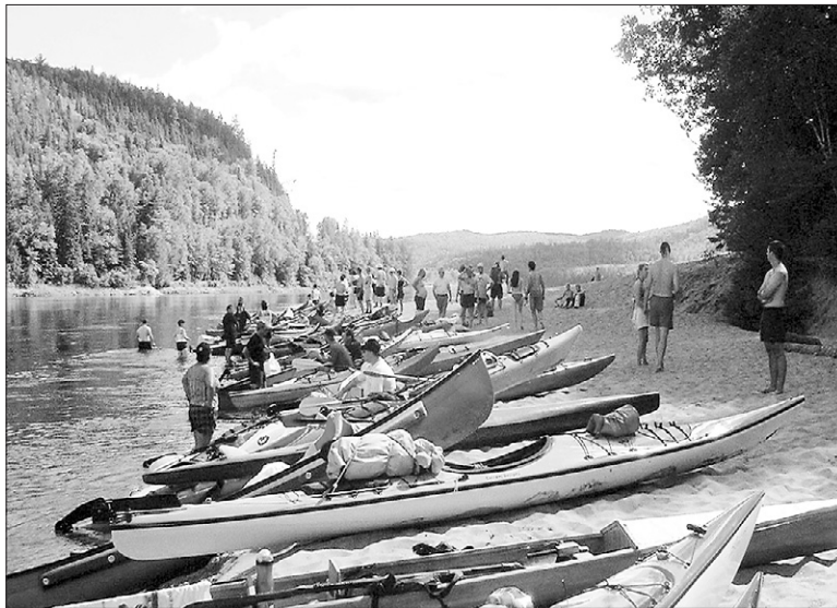
Les participants de la Descente des Draveurs en pleine pause.

Méconnue en raison, notamment, de l'utilisation industrielle qui en a été faite dans le passé avec le flottage du bois, la rivière Saint-Maurice possède les atouts nécessaires pour combler les attentes de tous les plaisanciers.