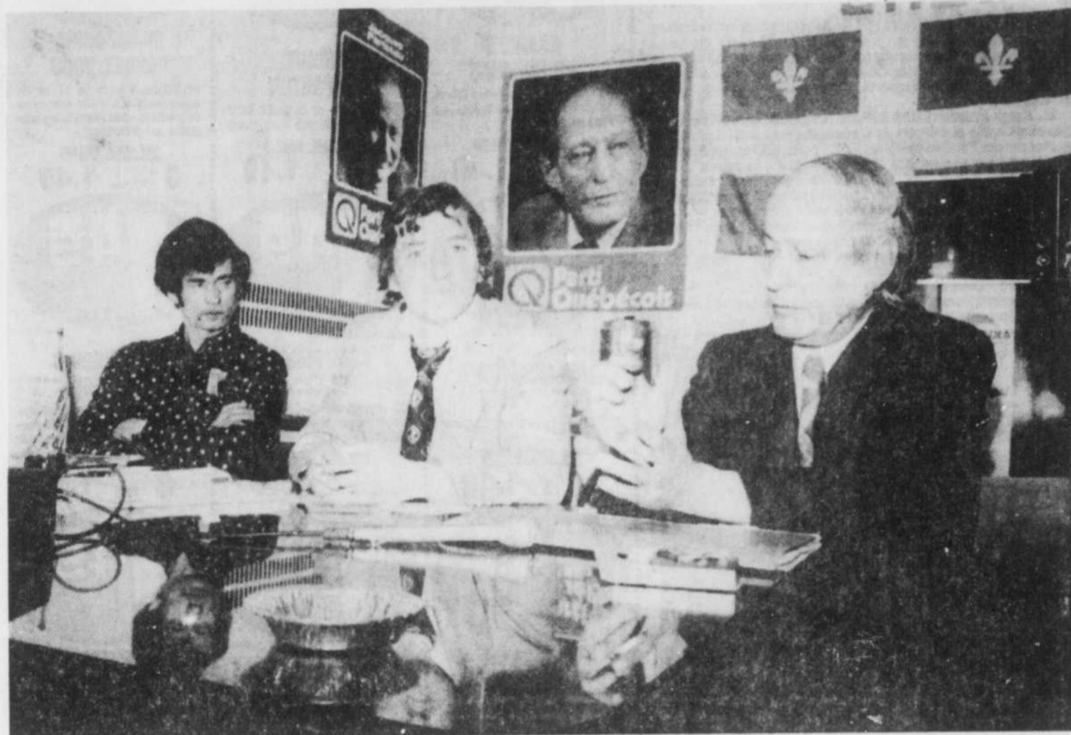
Le Chef du Parti Québécois a prononcé une allocution au local de cette formation politique samedi après-midi. Il était accompagné

Munich. Mais ici, le parti libéral ne veut pas donner un sou de plus et maintenant à peine de se déshonorer, il faudra continuer jusqu'au bout et payer pour les pots cassés..." d'expliquer M. Lévesque d'un ton enflammé.