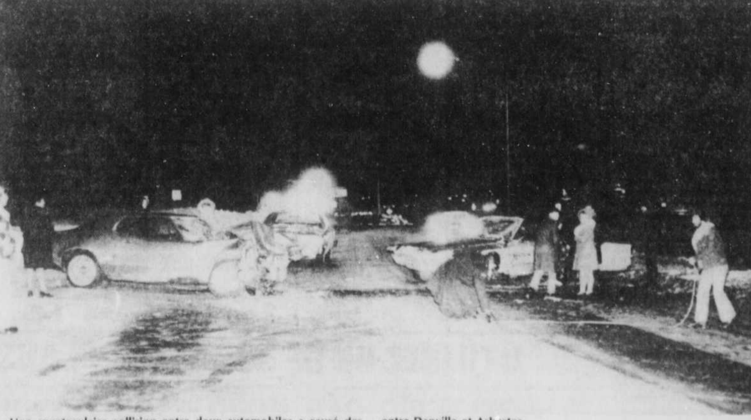
Une spectaculaire collision entre deux automobiles a causé des blessures à cinq personnes, dimanche à 0.45 a.m., sur la route 255 entre Danville et Asbestos.