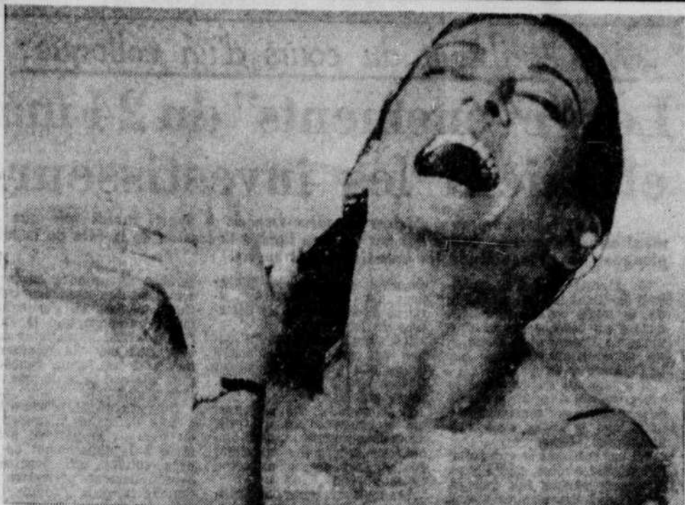
Plus besoin d'y penser... on peut maintenant aller à l'eau avec sa montre, grâce aux horlogers suisses. Ces montres, conçues spécialement pour la natation, sont offertes dans un choix de modèles munis de bracelets de couleurs vives, en harmonie avec le soleil.