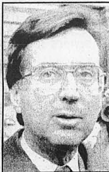
Robert Bourassa

Mais, avec l'actuel climat protectionniste américain, « il n'y avait pas de meilleurs choix »