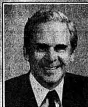
FREDERICK W. SMITH Président du conseil & chef de la direction Federal Express

FREDERICK W. SMITH sur "Le défi des entreprises d'aujourd'hui"