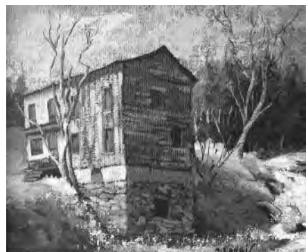
Le moulin Beaudoin, Alain Langis

AUTOUR DE CHEZ MOI, Alain Langis 26 février au 10 juin