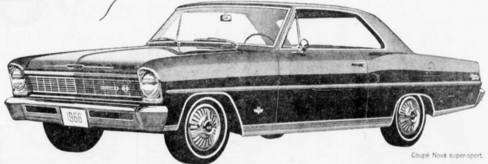
Coupé Nova super-sport.

La Chevy II — encore plus de chic qu'on n'imagineraient en trouver dans une voiture économique