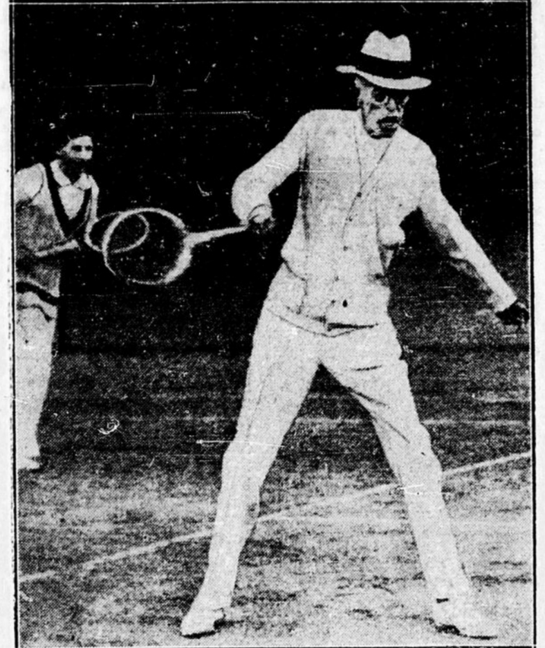
Voici une des plus récentes photographies de Sa Majesté le Roi Gustave-Adolphe de Suède, prise au Racing-Club de Paris, au cours d'un match enlevé. On voit en arrière du Roi de Suède le fameux tennismen français Jean Borotra.