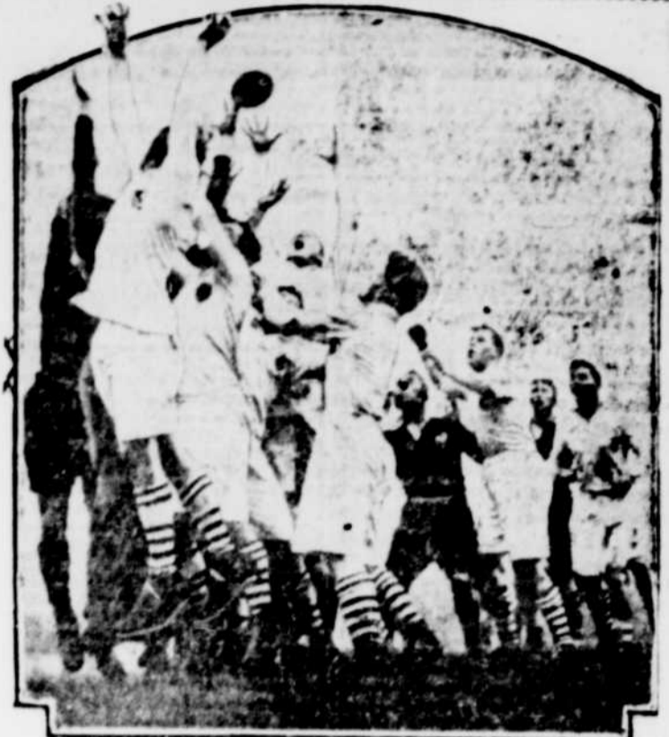
Instantané pris au cours de la partie de rugby qui s'est jouée entre Keat et Eastern Counties (les blancs) à Blackheath. Durant cette partie de championnat il y a eu beaucoup de situations amusantes.