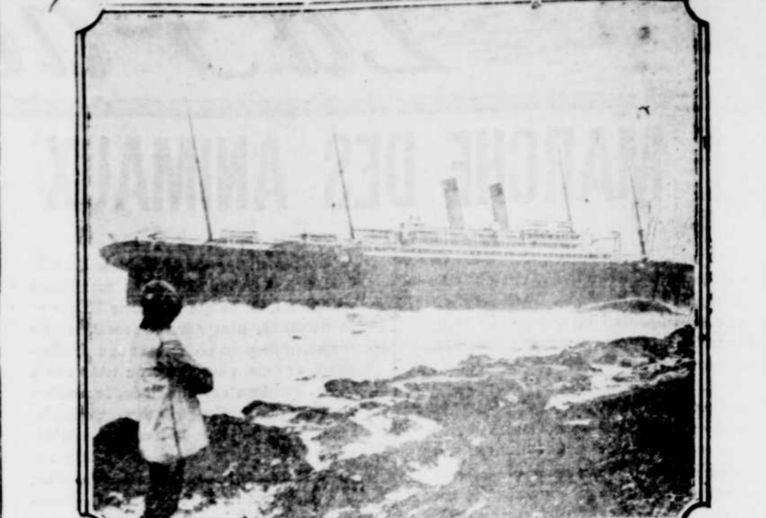
Remarquable photographie du "Celtic" qui s'est échoué il y a quelques temps sur les côtes d'Irlande. Il n'y a pas eu de perte de vies, mais le navire a dû être abandonné à son triste sort.

Si un humain perdait un tiers de sa population de Londres en 1921, le quartier collé de dentistes du pays, comme résultat d'un accident était 7,476,108 et le Grand New-York monde entier commençait à Baltimore en 1925 6,100,000.