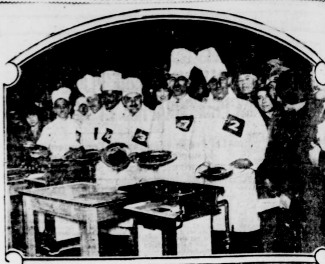
Styria, douze excellents plats ont été préparés pour la préparation de plats au poisson. De ces plats, certains les ont qui l'on voit les sont sortis victorieux.