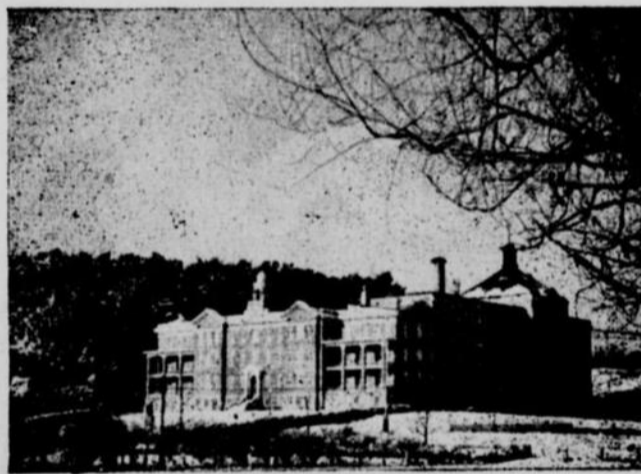
Ecole Supérieure d'Agriculture de Ste-Anne.