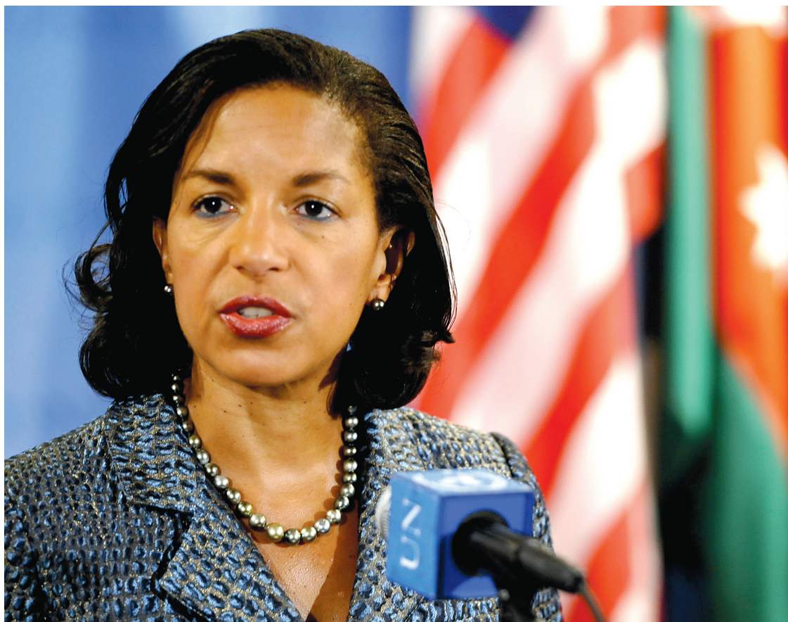
D'après la plupart des observateurs, c'est Susan Rice, présentement ambassadrice aux Nations unies, qui succédera à Hillary Clinton à la tête du Secrétariat d'État américain.

La faute qu'on reproche à Susan Rice, c'est de