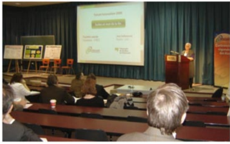
Plus de 140 personnes ont participé au Forum Innovation 2009. À la demande des participants, l'événement sera de retour l'an prochain.

La Commission a travaillé aux dossiers suivants tout en formulant des recommandations à la CRÉO et en participant notamment à l'organisation du Forum Innovation 2009 et aux travaux de la Table éducation Outaouais (TÉO).