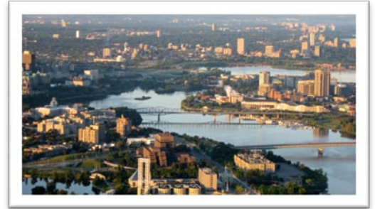
La réalité frontalière de l'Outaouais se traduit par une compétition pour l'attraction et la rétention de main-d'œuvre, celle-ci étant accentuée par la présence massive de la fonction publique fédérale à Ottawa.

Réalisation de l'étude d'impacts de l'attraction du gouvernement fédéral sur les administrations publiques provinciale et municipale de l'Outaouais. Participation à l'élaboration et à la mise en œuvre d'un plan d'action régional afin de maintenir et consolider la présence du gouvernement du Québec en région. 2009 sera l'occasion de pousser plus loin la mobilisation régionale pour augmenter la capacité d'attraction et de rétention de la région en matière de main-d'œuvre.