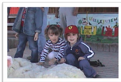
La mise en place du BERSO permettra de simplifier la recherche d'une place en services de garde pour les familles de l'Outaouais.

La CRÉO a participé activement à la mise en place et aux travaux du groupe de travail régional piloté par l'Agence de la santé et des services sociaux de l'Outaouais. Le Plateau intersectoriel de concertation pour le Plan d'action gouvernemental de promotion de saines habitudes de vie a notamment identifié les priorités régionales d'action pour les prochaines années. Un Forum régional sur les saines habitudes de vie a également été organisé par l'Agence le 24 avril 2009.