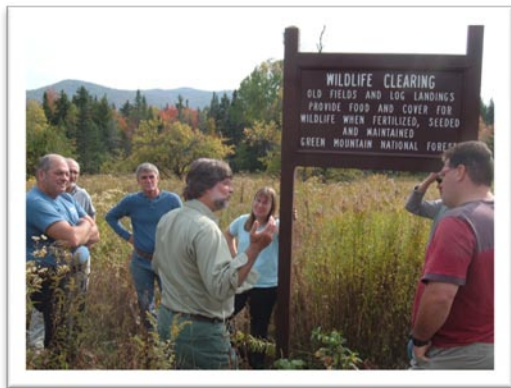
Le PPRMVF a notamment permis à un groupe de praticiens de l'Outaouais de partager les initiatives de mise en œuvre de l'aménagement écosystémique avec des collègues, en visitant un parc national du Vermont où celles-ci sont appliquées.

Pour atténuer les impacts de la baisse de la possibilité forestière sur territoire public, la CRÉO soutiendra la réalisation d'initiatives dans les champs d'activités suivants : Soutien aux intervenants pour la planification des activités d'aménagement forestier; Soutien en matière d'éducation forestière et de transfert technologique; Expérimentation de nouveaux concepts de gestion et d'aménagement des forêts.