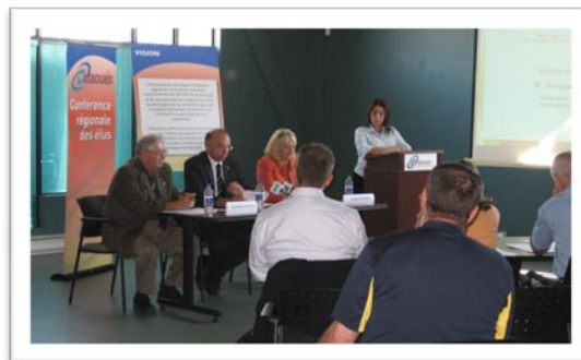
La CRÉO et LSO lors de la conférence de presse présentant les activités du Comité de concertation régionale sur les VHR.

La CRÉO a rédigé et présenté, en partenariat avec le CRCO, son avis régional sur le patrimoine culturel à la ministre de la culture, Madame Christine St-Pierre, qui était de passage en Outaouais le 26 mai 2008, dans le cadre de la tournée de consultation publique visant la révision de la Loi sur les biens culturels.