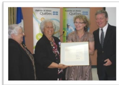
La ministre responsable des aînés, Madame Marguerite Blais, était de passage dans la région pour procéder au lancement de l'entente spécifique le 12 septembre 2008.

d'initiatives à portée régionale, élaborées en partenariat, notamment, avec la Table de concertation des aînés et retraités de l'Outaouais. Un projet est actuellement en développement, soit de mettre en place le projet Info-aînés, qui se veut un guichet unique d'information pour les aînés de l'Outaouais.