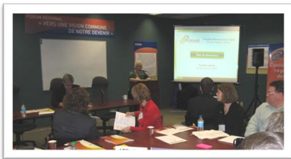
Le 2 ème Forum intersectoriel, le 23 janvier 2009, réunissait tous les membres des commissions régionales et du c.a. de la CRÉO.

La CRÉO a organisé le second Forum intersectoriel le 23 janvier 2009 dans le but de mobiliser et d'engager tous les membres des commissions régionales et du conseil d'administration de la CRÉO dans la réalisation d'actions régionales structurantes et intersectorielles. Les participants ont échangé sur la dynamique intersectorielle en regard de deux grands dossiers qui demandent la contribution de tous dans une intervention concertée, soit l'Approche territoriale intégrée (ATI) de lutte à la pauvreté et à l'exclusion sociale ainsi que le dossier de l'Identité régionale et la promotion de l'Outaouais.