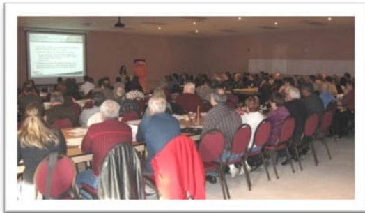
Le Forum régional sur la Protection des lacs et cours d'eau réunis plus de 120 acteurs du milieu le 21 novembre dernier.

La CRÉO a participé à la réalisation d'une étude sur l'état et la capacité des ponceaux, des ponts et des infrastructures du corridor ferroviaire Gatineau-Chelsea-La Pêche afin d'évaluer l'ampleur des travaux à réaliser dans le but de relancer le train à vapeur. Elle a par la suite participé activement au comité de relance du train à vapeur et a accordé un financement de 264 810 $ pour la relance de la saison 2009, qui a eu lieu le 9 juin.