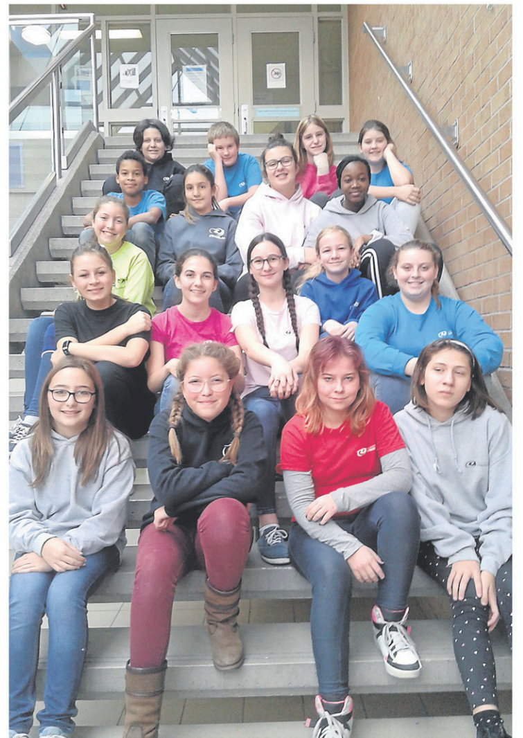
La troupe l'Envol de l'école l'Envolée.