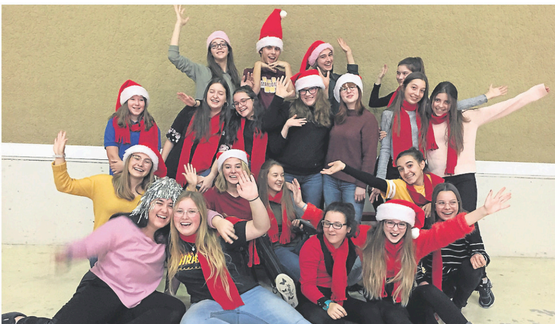
La Voix des vents de l'école de la Haute-Ville.

La Fondation du Centre hospitalier de Granby a dévoilé récemment la création du petit Chœur de la Fondation, composé de deux ensembles vocaux: la troupe de chant l'Envol de l'école l'Envolée et La Voix des vents de l'école de la Haute-Ville, toutes deux de Granby. Le petit Chœur de la Fondation regroupe 42 élèves du 1 er au 5 e secondaire. Ces jeunes représentants la relève du Grand Chœur de la Fondation, mettront à profit leur passion et l'offriront en cadeau à toute la région lors du Grand Défilé de Noël, le samedi 17 novembre, et du concert de Noël de la Fondation du CHG, qui sera présenté les 30 novembre et 1 er décembre au Palace de Granby. Pendant le Défilé de Noël, les deux troupes se promèneront pour faire du porte-à-porte chantant devant les commerces de la rue Principale, entre 14h et 16h. Par la suite, les jeunes chanteurs prendront place à bord d'un train chantant pour le Défilé. Également, le petit Chœur de la Fondation chantera dans le Foyer du Palace avant le début du Grand Chœur de Noël. Faire partie du petit Chœur de la Fondation demande aux jeunes de la préparation, de la pratique, de la détermination et de l'organisation, mais ce projet leur procure, surtout, une belle gratitude. Rappelons que la troupe l'Envol est dirigée par Manon Lacas, et que La Voix des vents, est menée par Johanne Lussier.